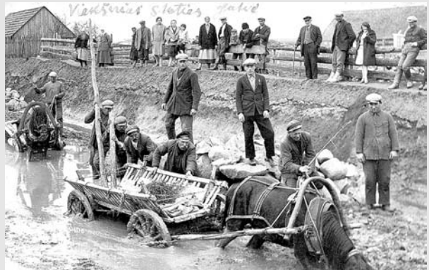
Stoties gatvė remonto metu. Vieksniai, apie 1940 m.