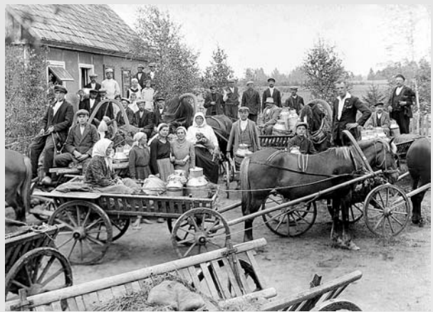
Pienvežiai. Vieksniai, apie 1935 m.