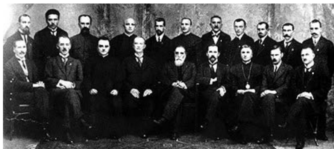
Pirmoji Lietuvos Valstybės Taryba (1918 m. vasario 16 d. pasirašė Lietuvos Nepriklausomybės Aktą). Iš kairės į dešinę: J. Vileišis, dr. J. Šaulys, kun. J. Staugaitis, S. Narutavičius, dr. J. Basanavičius, A. Smetona, kan. K. Šaulys, S. Kairys, J. Smilgevičius. Stovi: K. Bizauskas, J. Vailokaitis, D. Malinauskas, kun. V. Mironas, M. Biržiška, kun. A. Petrusis, S. Banaitis, P. Klimas, A. Stulginskis, J. Šernas, P. Dovydaitis.

S TANISLOVAS NARUTAVIČIUS – Gabrieliaus Narutavičiaus brolis. Jis – vienas iškiliausių XX a. pradžios žemaičių. Advokatas, visuomenės veikėjas, tautosakos rinkėjas, 1905 metų revoliucijos dalyvis, Vilniaus Didžiojo Seimo atstovas nuo Alsėdžių, Lietuvos Nepriklausomybės Akto signataras. Oficialiai iki šiol rašyta, kad S. Narutavičius gimė 1862 m. rugsėjo 2 d. Brevikių dvare (dab. Alsėdžių sen., Plungės rajonas). Stanislovo Narutavi-