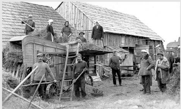
Kūlimo talka. Apie 1932–1934 m.