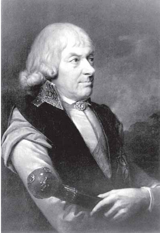
Kunigaikštis Mykolas Kazimieras Oginskis (1728–1800). Dailininkas nežinomas.