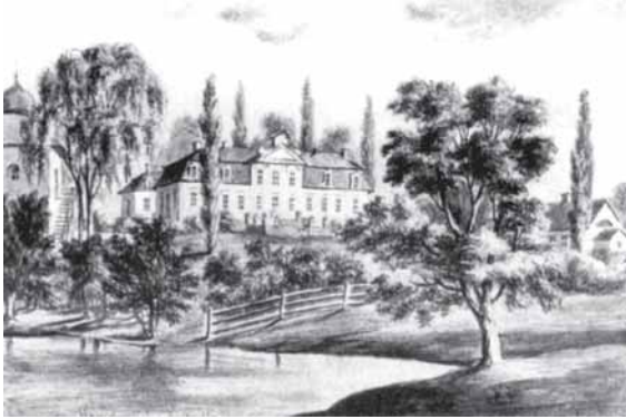
(Atkelta iš 71 p.)

savo dėdės Pranciškaus Ksavero Oginskio dvarą.