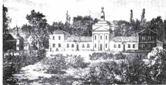
Iš kairės: Tado Pranciškaus Oginskio dvaro sodyba Hanutoje XIX a.; kunigaikščių Oginskių Zalesės dvaro sodyba XIX a. Napoleono Ordos piešiniai

1823–1833 m. M. K. Oginskis Florencijoje. Čia jis praleidžia