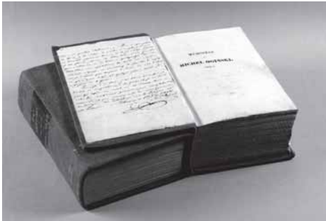
Mykolo Kleopos „Atsiminimai“, saugomi Vilniaus universiteto bibliotekoje.