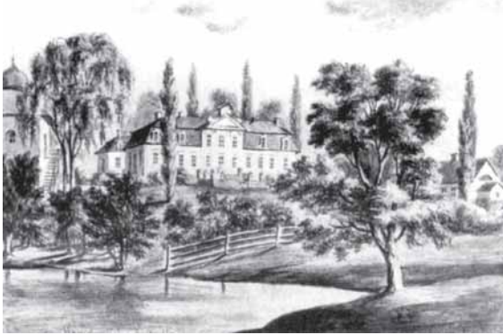
(Atkelta iš 71 p.)

savo dėdės Pranciškaus Ksavero Oginskio dvarą.