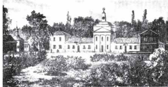
Iš kairės: Tado Pranciškaus Oginskio dvaro sodyba Hanutoje XIX a.; kunigaikščių Oginskių Zalesės dvaro sodyba XIX a. Napoleono Ordos piešiniai

1823–1833 m. M. K. Oginskis Florencijoje. Čia jis praleidžia