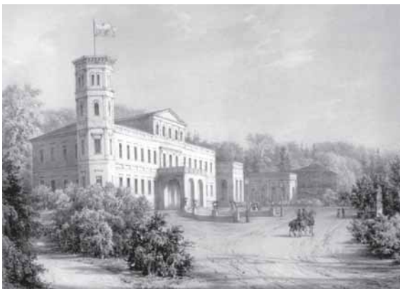
Rietavo dvaras XIX a. pabaigoje. Napoleono Ordos piešinys

* M. K. Oginskio ir jo epochos rašytinio palikimo leidyba lietuvių kalba;