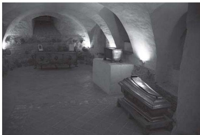
Ingos Kovalenkaitės nuotraukose – Kretingos Viešpaties Apreiškimo Švč. Mergelei Marijai bažnyčios rūsių ir jose esančių kriptų fragmentai

Netoli Chodkevičių kriptos yra 2005 m. rudenį pašventinta kankinių kripta, atsitiktinai sutrasta XX a. pr. Čia esančioje nedidelėje patalpoje surasti 120-ties žmonių palaikai. Manoma, kad XVII a. vid., vykstant karams su švedais, šie siautėjo po Kretingos miestą, plėšė katalikų bažnyčią ir tikinčiuosius kripte už-