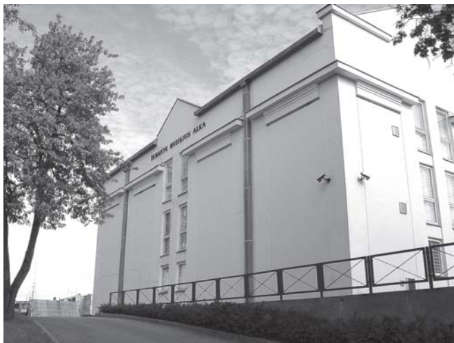
Žemaičių muziejaus „Alka“ naujojo priestato fragmentas iš pietų pusės.