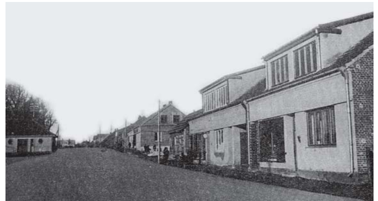
Luokės miestelio centrinė gatvė po sutvarkymo 1935 m.