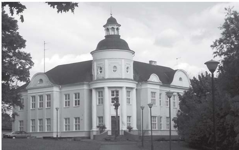
Telšių vyskupijos kurijos pastatas. 2005 m.