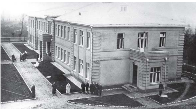
Viršuje – Jurbarko tuberkuliozės ligoninės fragmentas. Apačioje – Švėkšnos miestelio centras šiandien.