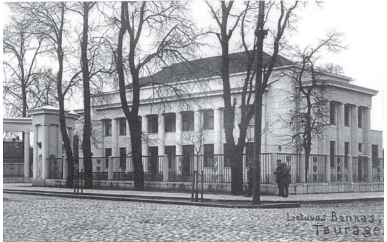
Lietuvos Bankas Tauragė