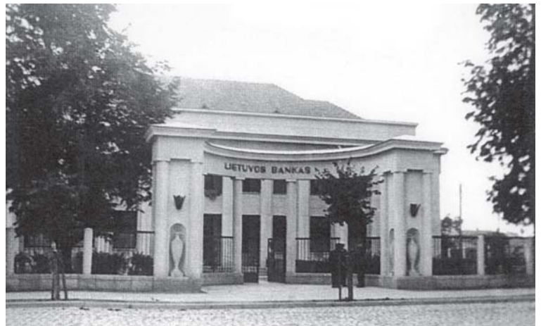
Lietuvos banko Tauragės skyriaus pastatas prieš Antrąjį pasaulinį karą.