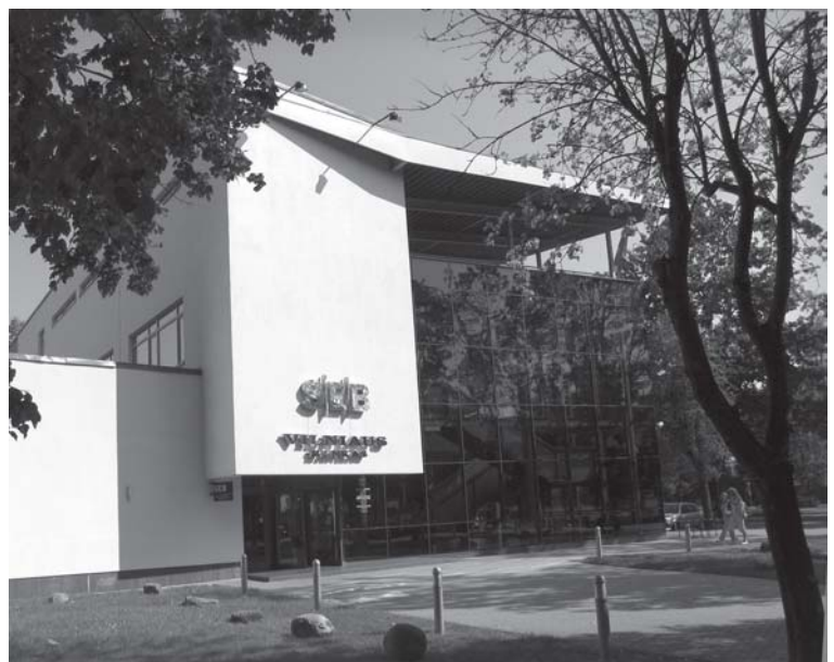
Vilniaus banko Mažeikių skyriaus pastatas 2006 m.