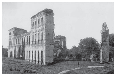
Iš kairės: Biržų pilies griuvėsiai. 1926.; Biržų pilis. XVI a. raizynas.