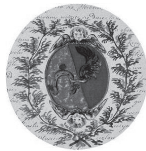
Iš kairės: dabartinis Biržų herbas; Biržų miesto herbas 1792-06-12 privilegijoje Nr. 67