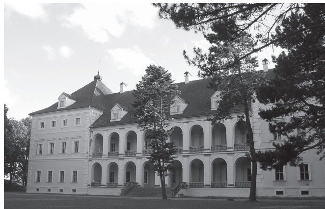
Biržų pilies rūmai (dabar Biržų krašto muziejus „Sėla“).

1705 m. rugpjūčio 6 d. Biržuose antrą kartą lankėsi Rusijos caras Petras I. Žinoma, kad jis, apsistojęs pilies teritorijoje li-