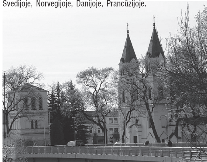
Pasvalio bažnyčia ir varpinė. S. Velykio nuotraukos fragmentas

Rajonas paskutiniaisiais metais turi bendradarbiavimo partnerių Švedijoje, Norvegijoje, Danijoje, Prancūzijoje.