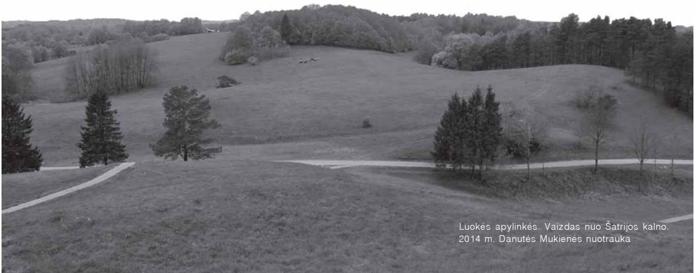
Luokės apylinkės. Vaizdas nuo Šatrijos kalno. 2014 m.

Vasarą vargingesnės miestelio moterėlės užsidirbdavo rinkdamos uogas. Avietes rinkdavo Biržuvėnų miške, mėlynės – Byvainėje. Ten augo ir bruknės. Ir aš nueidavau uogauti į šiuos miškus. Žemuoges rinkdavome Pašatrijos alksnynuose. Rugsėjūčio mėnesį prasidėdavo grybų sezonas. Ankstyvą rytą, dar saulei nepatekėjus, miestelio gyventojai skubėdavo į Guivėnus. Dažnai jų kelias vedavo per mūsų senelio sodybą. Guivėnai buvo labai grybingas miškas. Čia augo įvairiausi grybai. Beveik visi grybautojai namo grįž-