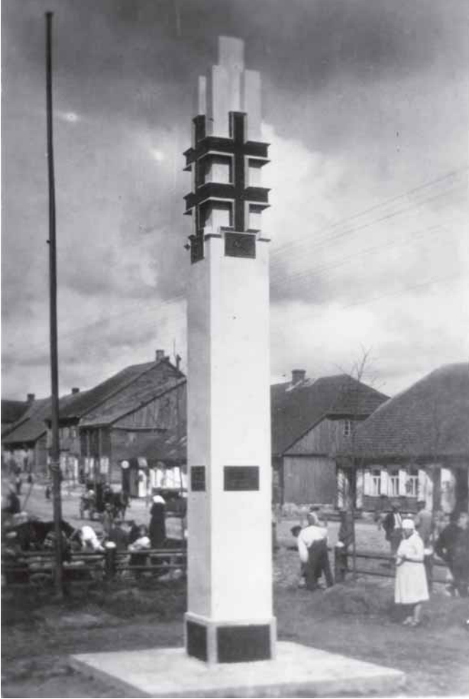
Lietuvos nepriklausomybės 10-mečio proga Luokėje Kosto Vaigausko sukurtas ir pastatytas paminklas (atidengtas 1929 m. rugpjūčio 15 d.). Už paminklo matosi dalis Turgaus aikštės ir Telšių gatvė. Fotografuota iki 1934 metų gaisro.