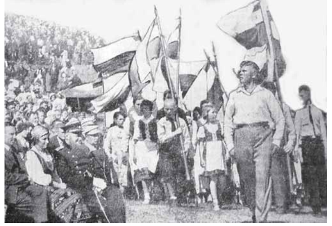
Nuotraukose: Tautos dienos renginių, vykusių ant Šatrijos kalno 1937 m. birželio 13 dieną, dalyviai. Iškilimėse dalyvavo apie 20 tūkst. žmonių. Fotografai nežinomi. Nuotraukos iš leidinio „Mūsų kraštas“ (1937-06-18, Nr. 25)