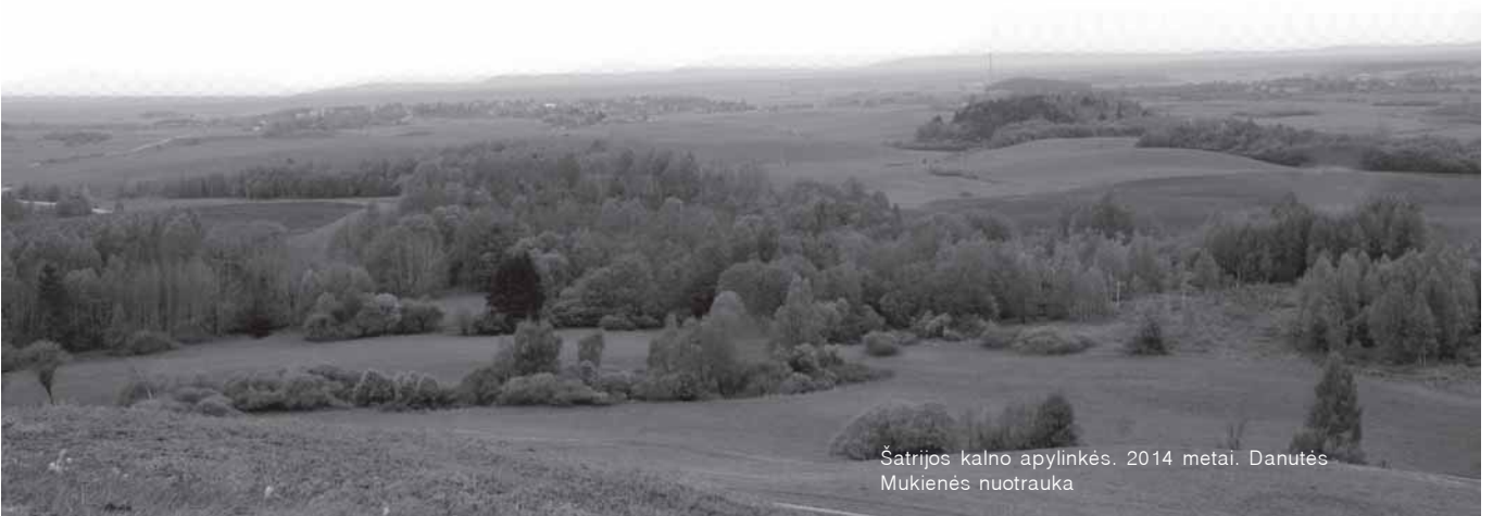
Šatrijos kalno apylinkės. 2014 metai.

Ankstų Kalėdų rytą visi skubėdavo į Bernelių mišias. Bažnyčia, išpuošta eglėmis, visa švytėdavo nuo žvakių šviesos – jos degdavo ant visų penkių Luokės bažnyčios altorių. Elektros tada dar nebuvo. Vėliau jau žibėjo elektros lempučių girliandos. Bažnyčia būdavo sausakimša žmonių iš miestelio ir suvažiuosiu ar atėjusių iš kitų parapijos vietovių. Linksmaus Kalėdų giesmes gražiai giedodavo bažnyčios choras, o jam pritardavo Šaulių sąjungos Luokės skyriaus dūdų orkestras. Viešpataudavo nenusakomai iškilminga ir džiaugsminga nuotaika, visi džiaugdavomės gimus Kūdikėliui Jėzui, ir šviesiau darėsi širdyje.