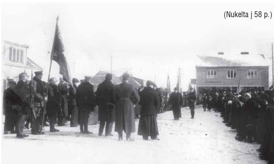
(Nukelta į 58 p.)

Iš meilės tais laikais tuokdavosi nedaug kas. Dažniausiai jaunosius supiršdavo. Svarbų vaidmenį vaidino pasoga, nes reikėdavo broliams ir seserims išmokėti dalis ar atiduoti ūkio skolas. Vis dėlto taip sukurtos šeimos buvo gana patvarios – oficialių skyrybų negalėdavo būti. Vieniųjų motinų nebuvo daug, tačiau pasitaikydavo.