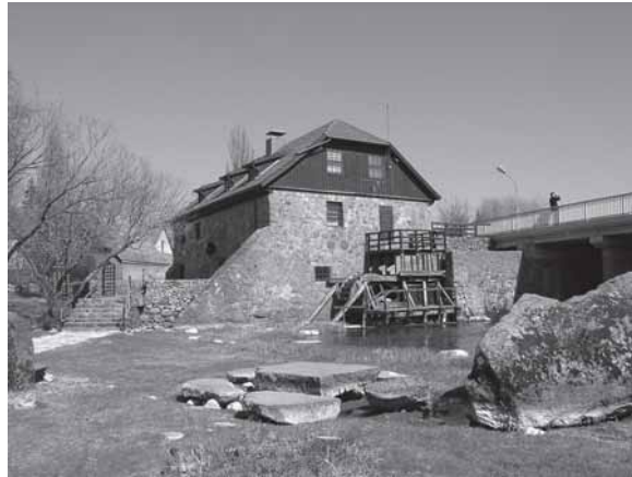
Mosėdžio vandens malūnas, kuriame dabar įrengta Respublikinio Vlado Into akmenų muziejaus kamerinė dalis ir veikia šio muziejaus administracija.