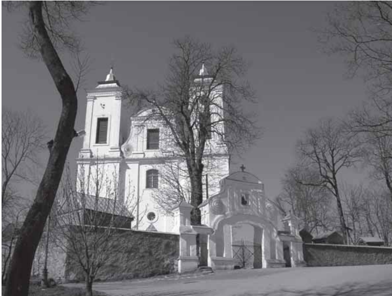
Mosėdžio šv. arkangelo Mykolo bažnyčia.