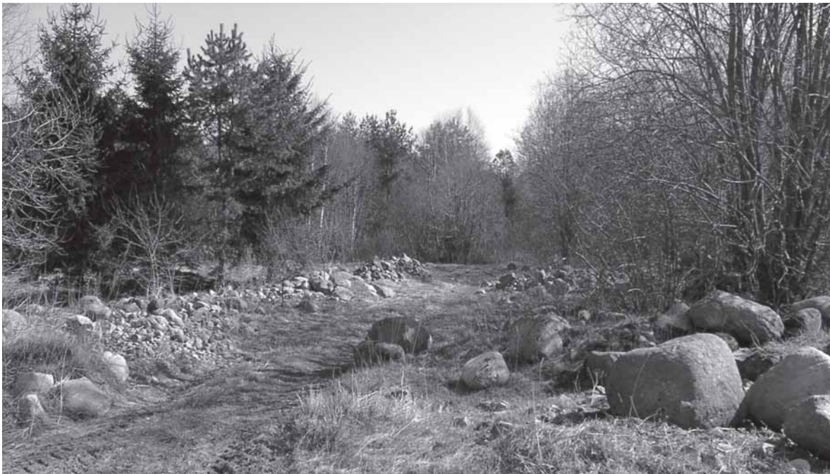
Šauklių pamiškės pavasarį, pasibaigus akmenų rinkimo darbams.