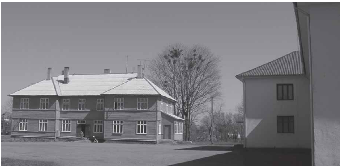
Kairėje – pokario metais veikusios Mosėdžio vidurinės mokyklos senasis pastatas.