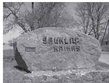
Šauklių kaimo riboženklis. Danutės Mukienės nuotrauka