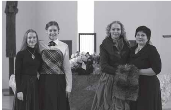
Koncerto dalyvės.