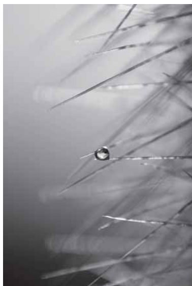
(iš viršaus): „Kelias į rytojų“ ir „Gėrio lašelis“