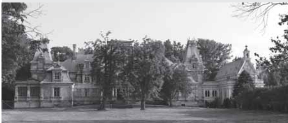
Guzovo dvaro rūmai.

M. K. Oginskio tėvai buvo grafitė Paula (Paulina) Šembek (1737–1798) ir Lietuvos didysis kancleris, Trakų vaivada ir kaštelionas kunigaikštis Andrius Ignas Joachimasis Juozapotas Oginskis (1740–1787). Jie susituokė 1763 m. liepos 21 d. Guzovo miestelyje (prie Miednevicų, Lodzės vaivadija, Lenkija, netoli Varšuvos).