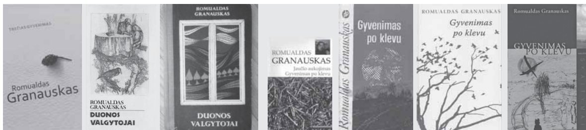
Romulado Granausko knygų viršeliai

2014 m. pasirodė paskutinioji R. Granauskui gyvam esant išleista knyga – apsakymas ir esė „Trečias gyvenimas“ (ją taip pat išleido Lietuvos rašytojų sąjungos leidykla).