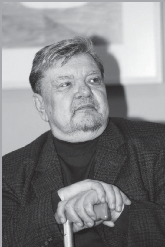
Romualdas Granauskas (1939–2014).

Per 2014-ųjų Vėlines Vilniaus Antakalnio kapinių Menininkų kalnelyje prie naujai supiltų kauburėlių dažnai galėjai išgirsti žemaitišką šneką. Dažnas iš atėjusiųjų būriavosi, žvakelę už-