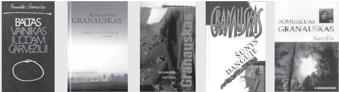
Romulado Granausko knygų viršeliai