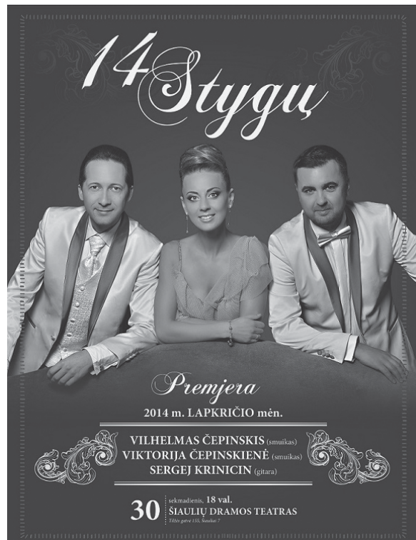
Šiaulių dramos teatro spektaklio „14 stygu“ premjeros afiša