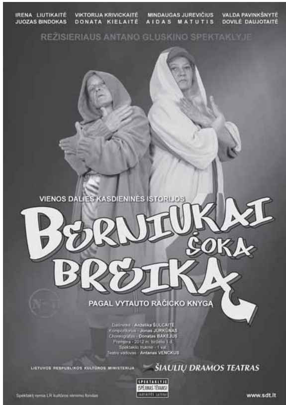
Šiaulių dramos teatro spektaklio „Berniukai šoka breiką“, pastatytą pagal Vytauto Račicko knygą, afiša