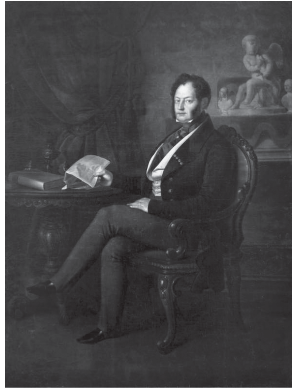
Mykolo Kleopo Oginskio portretas. Dailininkas Juozapas Oleškevičius (1777–1830) (?) Drobė, aliejus, 194 x 146,5 cm. Portretą saugo Nacionalinis M. K. Čiurlionio dailės muziejus, Mg 2292.

M. K. Oginskis – pirmasis iš muzikų pradėjęs puoselėti koncertinės paskirties polonezų komponavimo tradiciją. Populiariausias M. K. Oginskio kūrinys – polonezas a-moll Nr. 13 „Atsisveikinimas su Tėvyne“ („Les Adieux à la Patrie“). Atlaikiusi visas istorinių lūžių negandas ir laiko išbandymus, šio kūrinio melodija, jos raiškiai moduluoti, atsikartojantys akordai, tauraus ilgesio ir optimistinės vilties motyvai jaudina ir ugdo daugiamilijoninę muzikinės kultūros puoselėtojų auditoriją. Ne tik Lietuvoje, bet ir Lenkijoje, Baltarusijoje,