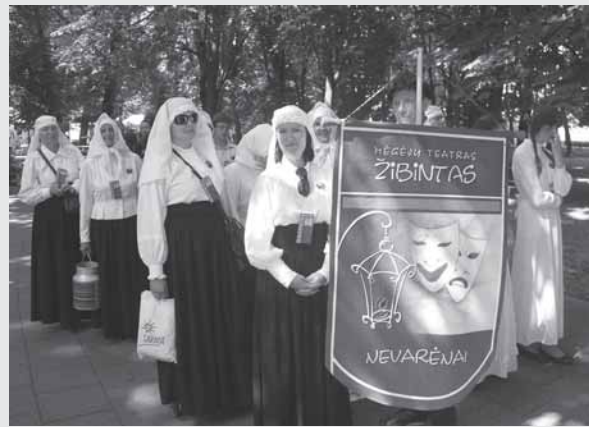
2014 m. lietuvių dainų šventės „Čia – mano namai“ Teatro dienos „Dyvų dyvai“ šventinėje eisenoje – Žemaitijos mėgėjų teatrai