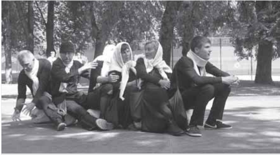
Vaidina Palangos „Grubusis“ teatras