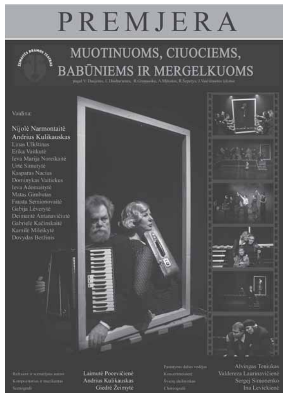
Telšių rajono savivaldybės Žemaitės teatro spektaklio „Muotinuoms, ciuciems, babūniems ir mergelkuoms“ premjerai skirtas plakatas