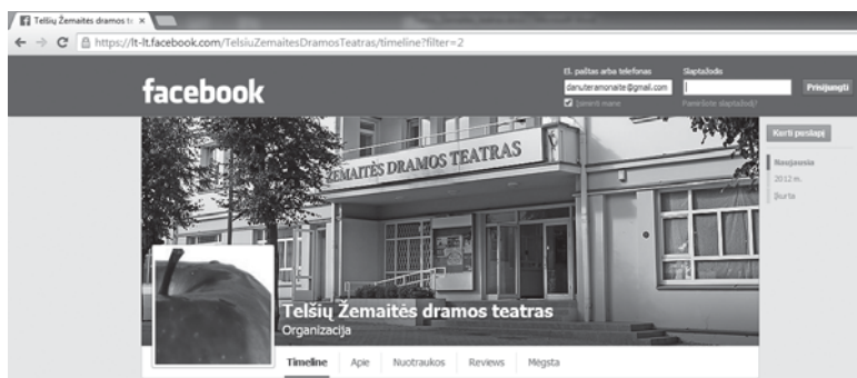
Telšių Žemaitės teatro puslapis Facebook'e 2014 m. rugpjūčio mėnesį

Lietuviški vakarai telšiškius paskatino įkurti „Kanklių“ draugiją (oficialiai jos veikla įteisinta tik po kelerių metų – 1916 m.). Draugijoje veikė dramos sekcija. Jos nariai repetuodavo telšiškio Mikalausko name (Kauno gatvė). Yra žinoma, kad didelio vi-