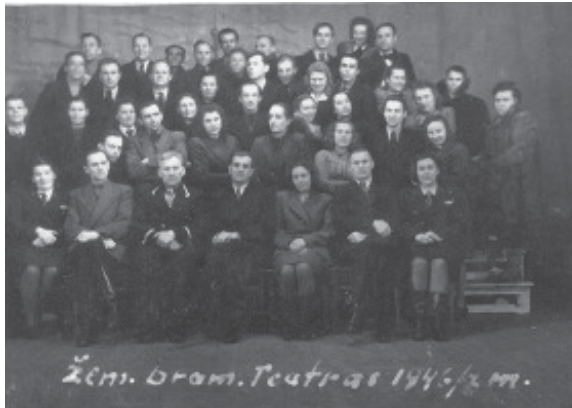
Telšių dramos teatras 1946 metais.