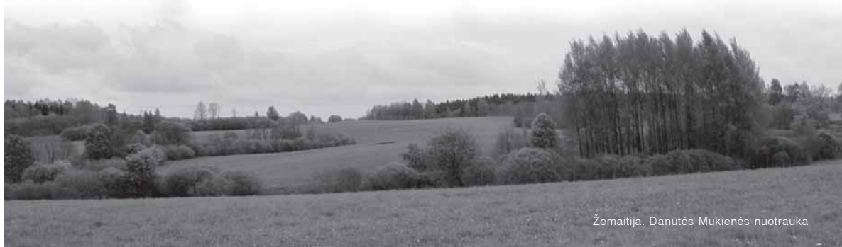
Žemaitija.