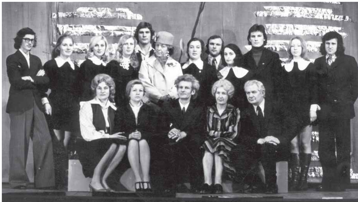
Kretingos dramos teatro kolektyvas po Tamaros Jan spektaklio „Mergaitė ir pavasaris“ premjeros 1976 metais.