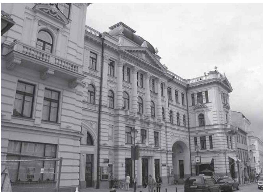
Lietuvos nacionalinės filharmonijos pastatas 2014 m.