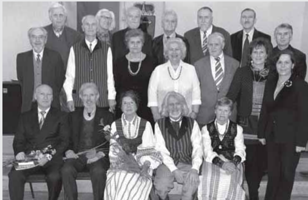
Kairėje – akimirks iš Vilniaus žemaičių kultūros draugijos 25-mečiui skirto renginio, vykusio 2014 m. gegužės 18 d. Vilniaus mokytojų namuose. Dešinėje – Vilniaus žemaičių kultūros draugijos aktyvas.