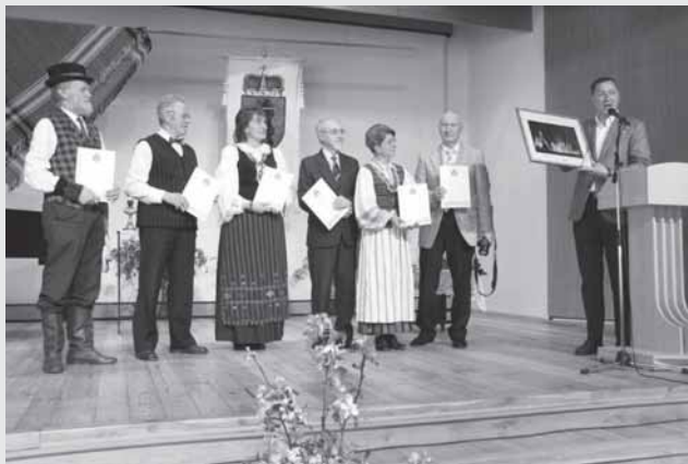
Scenoje – Vilniaus miesto savivaldybės Padėkos raštais apdovanoti Vilniaus žemaičių kultūros draugijos nariai. 2014 m. gegužės 18 d. Tribūnoje – Vilniaus meras Artūras Zuokas.

Draugija palaiko glaudžius ryšius su daugelio kitų miestų ir rajonų žemaičiais, kurie į bendrijas, draugijas buriasi bendriems žemaičių kultūros pažinimo ir puoselėjimo darbams. Palaikomi ry-