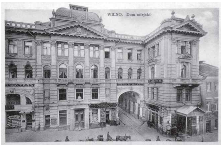
Lietuvos nacionalinės filharmonijos pastato atvirukas. XX a. pr.

gal archit. J. Pusje projektą buvo suremontuotas stogas ir vidaus įranga (durys, krosnys, grindys, sienos). Laikotarpyje tarp 1803–1841 m. miestas pastatą nuomojo privatiems asmenims.