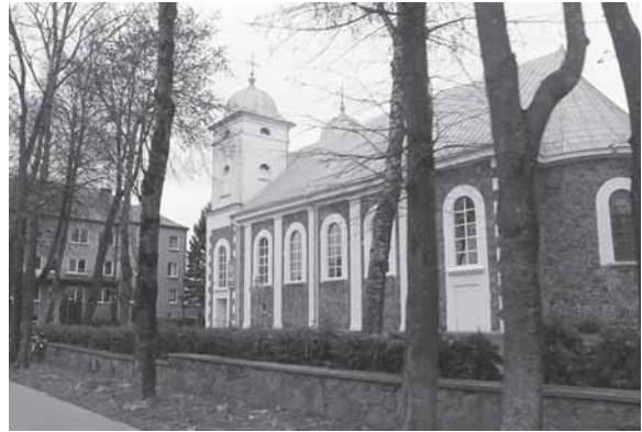
Skuodo Švč. Trejybės bažnyčia. 2013 m. ruduo.