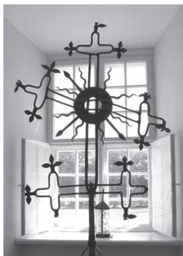
Metalinė kryžiaus viršūnė Žemaičių vyskupystės muziejuje.