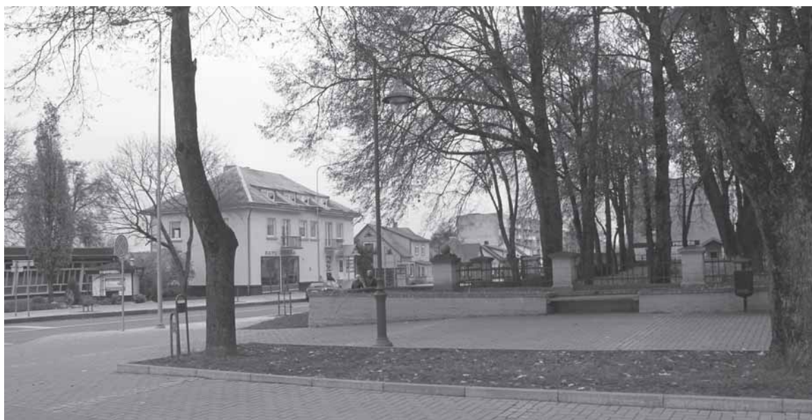
Skuodo miesto centre. 2013 m. rudenį.