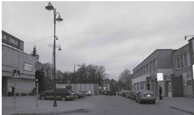
Skuodo miesto centras 2013 m. rudenį.

pamilę jį už teisingus ir tėviškus sprendimus, už naudojimąsi valdomis sunėšę net 15 000 raudonųjų auksinų, nereikalavdami net jokio raštiško paliudijimo. Tai rodo Skuodo valstiečių nuoširdumą ir jų geras buitines sąlygas.