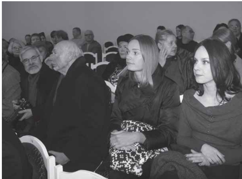
Algimanto Aleksandravičiaus knygos „Žemaitėję – mona meilė“ pristatymo visuomenei, įvykusio 2014 m. sausio 27 d. Vilniaus mokytojų namuose, akimirkos.