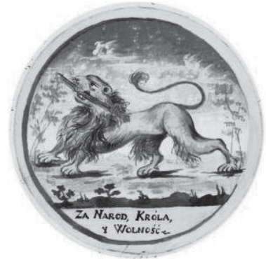
Rietavo herbas 1792 m. privilegijoje

1794 m. gruodžio–1795 m. sausio mėnesiais M. K. Oginskis atsisakė Jekaterinos