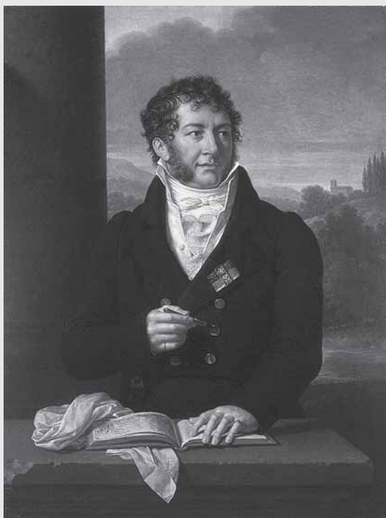
Mykolo Kleopo Oginskio (1765–1833) portretas. Dailininkas Fransua Ksavjė Fabras (1766–1837). Paveikslas saugomas Lietuvos dailės muziejuje