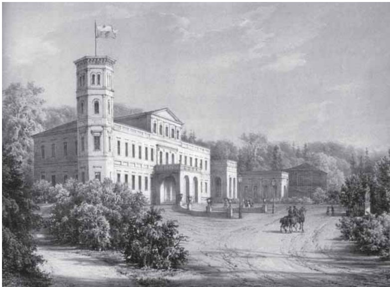
Rietavo kunigaikščių Oginskių dvaro sodyba XIX a. pabaigoje. Napoleono Ordos piešinys

1798 m. vasario 12 d. Peterburge mirė buvęs karalius Stanislovas Augustas Poniatovskis.