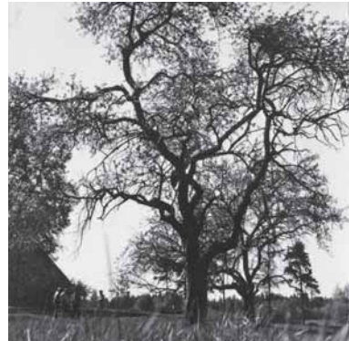
Vytauto Mačernio tėviškėje.

O liepoms pats darbymetis, saldžiai žydėdamos išeina į vienatvę. Sugrįžk, sakau,