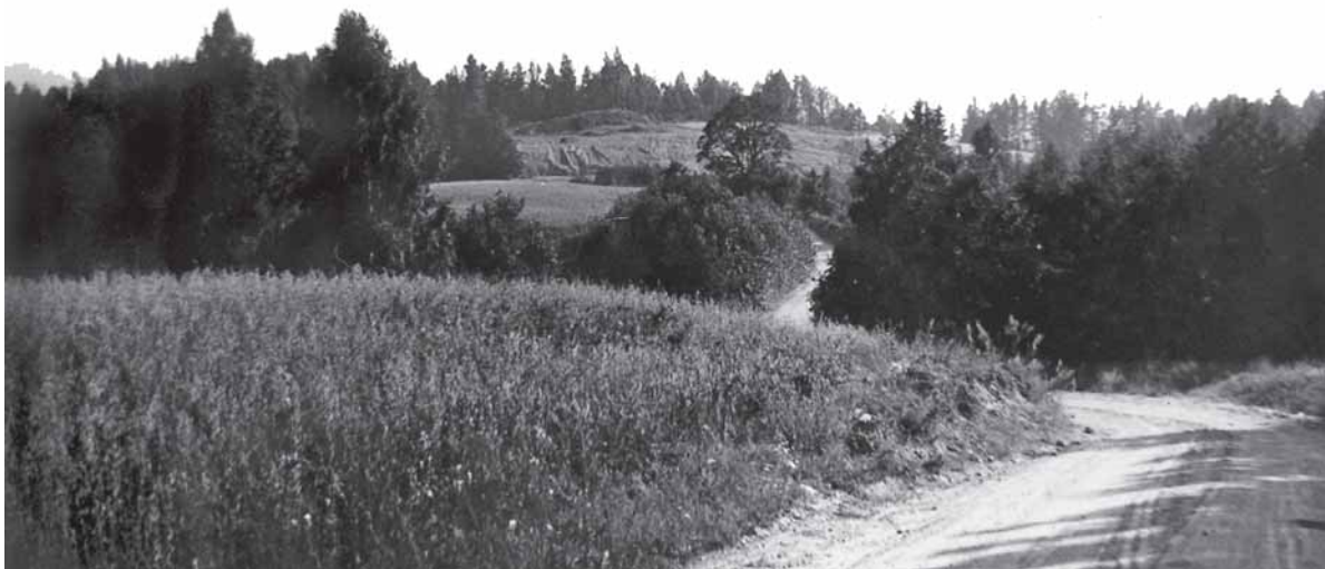
Šarnelės apylinkės.

O gubernatoriaus vieta, nelaimėi mano, dar laisva, dar laikrodžiai apklausinėja laiką Žemaitijoj. Kada ir kaip palaidosit mane pusiaukelėj tarp kryžiaus ir dangaus pusiaukelėj tarp medžio ir gandralizdžio.