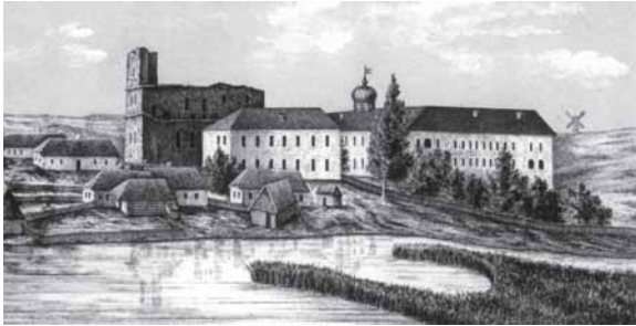
Kražių kolegijos bažnyčios griuvėsiai ir pojęzuitinės mokyklos pastatai. XIX a.