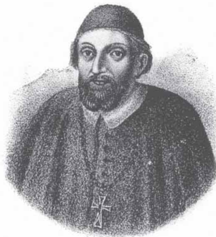
Žemaičių vyskupo Merkelio Giedraičio, vyskupo pareigas ėjusio 1576–1609 m., portretas

menko jo didžiulės imperijos pakraščio – Žemaitijos – valdovu. Simboliškai Žemaičių kunigaikščio titulas atsidūrė Rusijos caro titulų sąrašė.