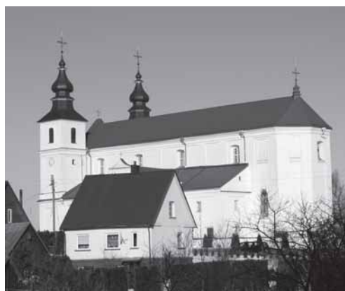
Varnių katedra (Šv. Petro ir Pauliaus bažnyčia). 2013 m.

Patekus carinės Rusijos sudėtin, nebeliko Žemaičių seniūnų, savivaldos, o atsiradęs pavadinimas Žemaičių žemė, imtas vartoti įvardyti kraštui, kuriame vyrauja žemaičių dialekta, taip ir nesiformavę į bendrinę žemaičių kalbą, nors pastangų tam būta (Giedriaus Subačiaus tyrinėjimai).