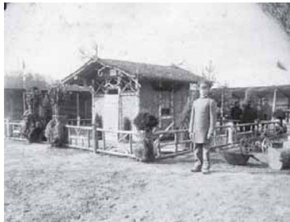
Žemės ūkio paroda. Miškininkystės paviljonas. Rietavas. 1878 m.

jaus pastato rūsius. Šio muziejaus pavyzdys rodo, kad Lietuvos muziejų istorinės fotografijos rinkiniai, kurie gali padėti identifikuoti XIX a. II p. – XX a. pr. Lietuvos istorijos įvykius ir juos išsamiai pristatyti, asmenis, kurie juose dalyvavo, bei aplinką, kurioje tie asmenys gyveno, nėra baigtiniai. Jie nuolat pasipildo naujais eksponatais. Jų vertė, vykstant tyrinėjimo, identifikavimo procesui, didėja. Visa tai mums sudaro galimybę geriau pažinti save, savo istoriją, o kitiems – pažinti mus, patikslinti kai kuriuos mūsų istorijos puslapius.