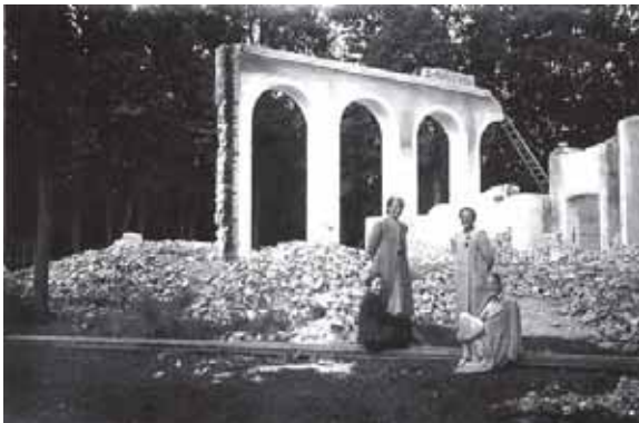
Prie baigiamų sunaikinti Rietavo Oginskių dvaro rūmų galerijų arkadų. XX a. 3 deš. pabaiga.