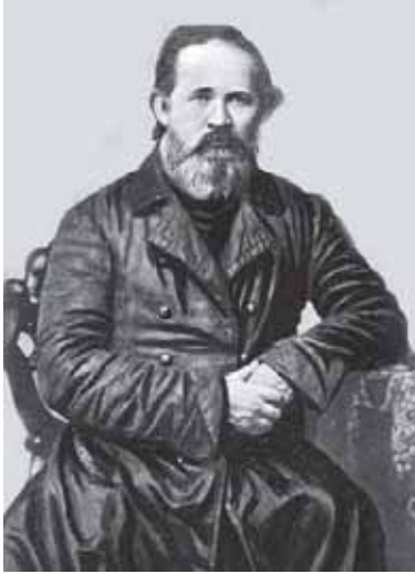
Kunigas Antanas Juška Kauno kalėjime 1864 m.

senosios fotografijos jau yra suskaitmenintos arba yra skaitmeninamos ir automatizuotai aprašomos dirbant su Lietuvos integralia muziejų informacine sistema. Fotografijų meta duomenys susiejami su nuotraukų skaitmeniniais vaizdais, visa ši informacija viešinama LIMIS sistemos portale www.limis.lt ir per projekto vykdytojus teikiama į portalą „Europeana“ www.europeana.eu .