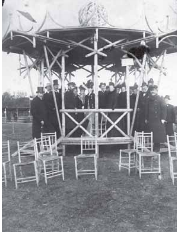
Žemės ūkio paroda. Organizatoriai ir svečiai centriniam paviljone. Rietavas. 1878 m.

Paskutiniaisiais metais Žemaičių muziejaus „Alka“ fotografijos rinkiniai pasipildė itin vertingomis stiklo negatyvų kolekcijomis, kurios buvo surastos rekonstruojant prieškarinio metais pastatyto muzie-