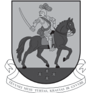
Veiviržėnų herbas. Dailininkas R. Miknevičius

torijoje pastatyta pirmoji fasadu į rytus atsuksa Veiviržėnų bažnyčia, turėjusi baroko stiliaus bruožų. Ji tuo metu buvo Rietavo parapijos filija. Tikėtina, kad koplyčios tipo bažnyčia Veiviržėnuose galėjo stovėti jau XVI a. – XVII a. pr., tačiau tai paliudijančių dokumentų nėra išlikę.