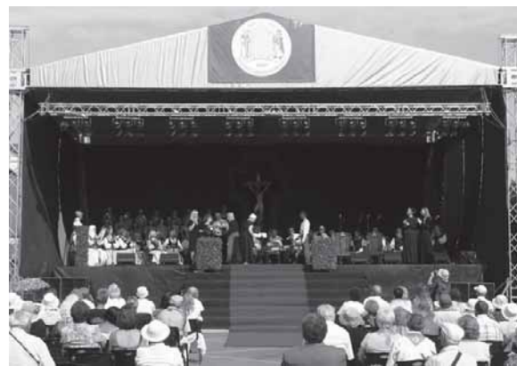
2013 m. rugpjūtis. Telšių vyskupijos IV eucharistinis kongresas Telšiuose.

Tokiomis iškilmingomis pamaldomis tą rugpjūčio 4-ąją buvo užbaigtas ketvirtasis Žemaitijos krikšto 600 metų jubiliejui skirtas Telšių vyskupijos eucharistinis kongresas. Eucharistinis kongresas Telšių vyskupijoje baigėsi, tačiau jubiliejiniai renginiai tęsiasi visus šiuos metus. Jubiliejus bus švenčiamas iki pat 2017-ųjų – Žemaičių vyskupystės įkūrimo 600 metų jubiliejaus.