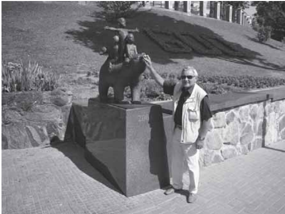
Prie skulptūros „Žemaitijos legendos“ (Telšiai, 2008 m., skulptorius Romualdas Kvintas, architektas Algirdas Žebrauskas). 2013 m.