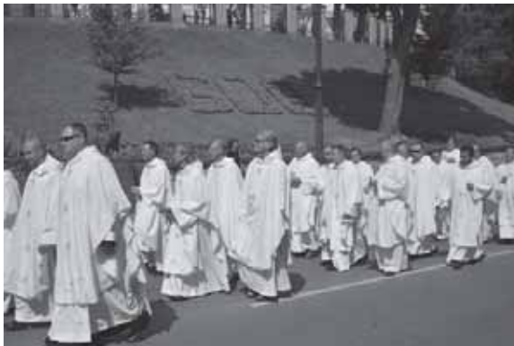
2013 m. rugpjūčio 4-oji – paskutinė Telšių vyskupijos IV eucharistinis kongreso diena Telšiuose.