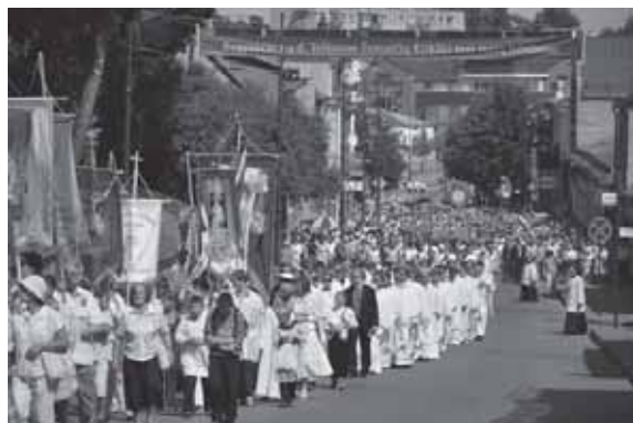
2013 m. rugpjūčio 4-oji – paskutinė Telšių vyskupijos IV eucharistinis kongreso diena Telšiuose.