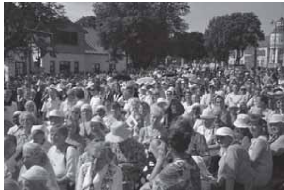
2013 m. rugpjūčio 4-oji – paskutinė Telšių vyskupijos IV eucharistinis kongreso diena Telšiuose.

pai ir Lietuvos tikintieji, kad galime švęsti šį svarbų šio krašto atsivertimo Jubiliejų kartu jungdami jį su Eucharistiniu kongresu, kuris įkūnija daugybę valandų adoracijų, iškilmingų procesijų, o ypač dažnos šv. Komunijos priėmimo praktikas. Jėzus pats mus moko prašyti Dievo Tėvo būtiniausių mūsų gyvenimui dalykų. Tarp materialinių gėrybių minima kasdieninė duona. Duona, kuri leidžia mums išgyventi. „Kasdienės duonos duok mums šiandien“, kalba mums Evangelija pagal Matą. „Kasdienės duonos duok mums kiekvieną dieną“, mums mini Evangelija pagal Luką. Ar tai nėra, iš tiesų, tas vertingas šios žemės lobis, kurio mes turėtume siekti? Jei kuris tampa turtingas, negali išskirtinai tuo mėgautis vien tik dėl savo gerovės, ir jis negali tuo turtu vien savavališkai ir kapringai naudotis, bet turi suvokti savo didelę atsakomybę vargšų atžvilgiu, tų, kurie gyvena iš savo tiesioginio darbo ar viešojo gėrio. Kasdieninė duona pagal Bažnyčios Tėvus yra duona, kuri leidžia mums išgyventi, ji yra taip pat ir ta duona, kurios esmė yra perkeičiama. Ši duona tampa mums Eucharistijos ženklų. Todėl šv. Ambraziejus sako: „Jei duona yra kasdieninė, kodėl tu ją gauni tik kartą metuose? Priimk ją kiekvieną dieną tai, kas tau yra reikalinga kiekvienai dienai. Gyvenk taip, kad galėtumei būti vertas kiekvieną dieną Ją priimti“. Dalyvavimas Kristaus gyvenime turi persmelkti visą mūsų gyvenimą. Priimti šv. Komuniją kiekvieną dieną yra svarbus dalykas mūsų tikėjimui, meilės darbams ir gyvybingai