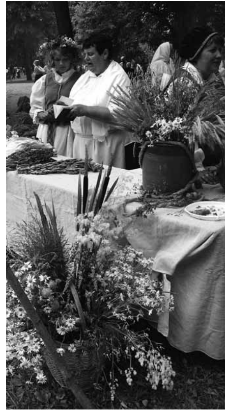
Vasaros žolynai kermošiuje.

jus – atsisveikinimo su išskrendančiais gandrais diena. Sakoma, kad gandrai dažniausiai gimtinę palieka apie rugpjūčio 24-ąją. Liaudis sako, kad nuo Šv. Baltramie- jaus velnias į vandenį įkiša geležį. Tai reiškia, kad vanduo upėse ir ežeruose pradeda atšalti. Senoliai sakydavo, kad nuo Šv. Bal- tramiejaus varlei Dievas užrakina dantis.