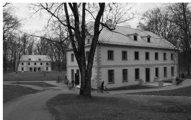
Jūros upė ties Jurbarku ir Jurbarko krašto muziejus Jurbarko parke.