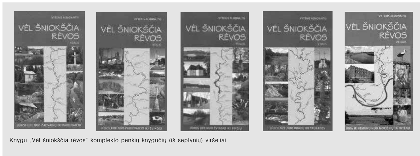
Knygų „Vėl šniokščia rėvos“ komplekto penkių knygų viršeliai (iš septynių) viršeliai

orientuoja žygeivį, teikia žinių apie upę ir jos pakrantes, apie kovas su kryžiuočiais, tame krašte gyvenusias baltų gentis, regiono gyvūniją ir augmeniją, architektūrą, gyvenamosios kultūros ypatumus. Ypatingas dėmesys skiriamas antisovietinių rezistencijos kovų dalyviams, jų atminimo paminklams.