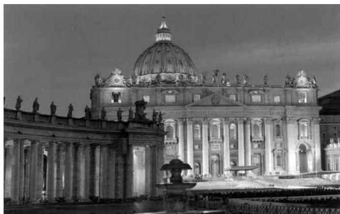
Romos Šv. Petro bazilika.