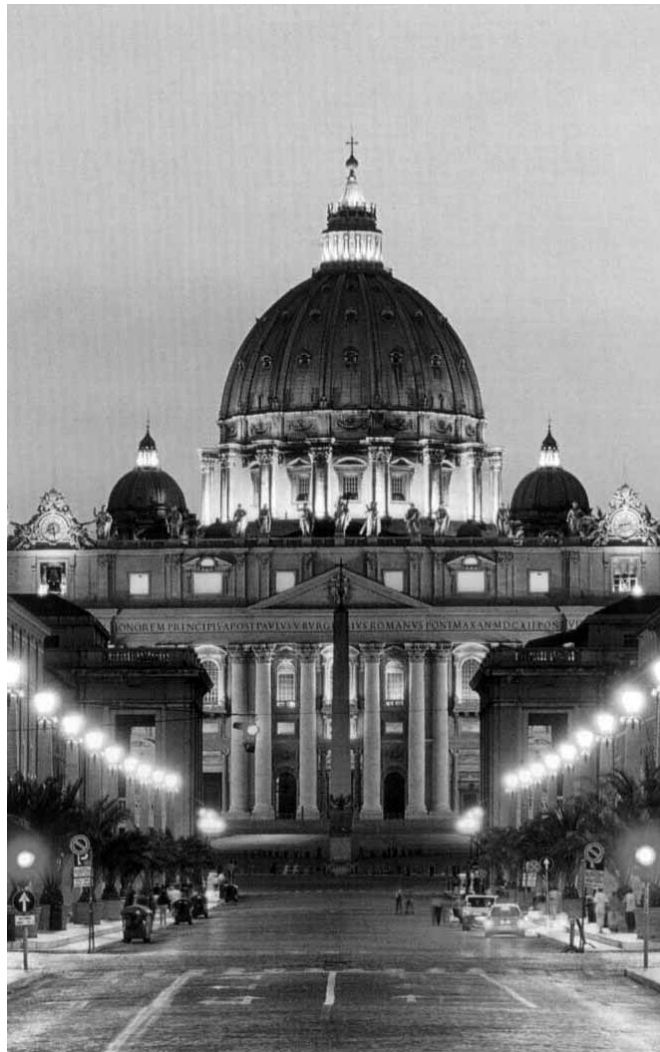
Romos Šv. Petro bazilika.