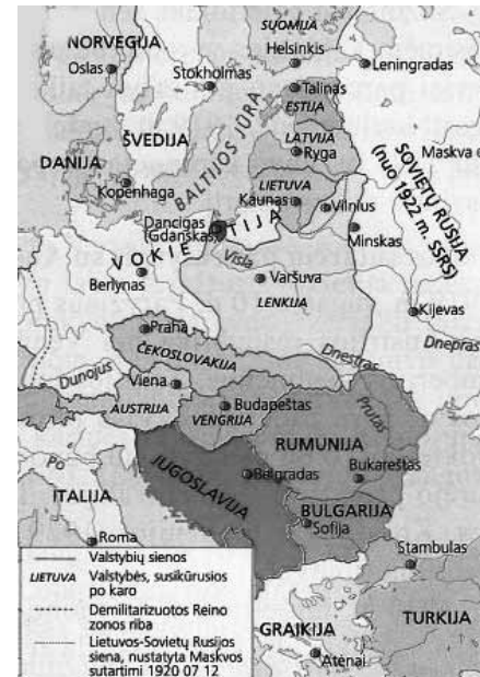
Europos šalys prieš ir po Pirmojo pasaulinio karo. Žemėlapiai iš leidinio www.istorikas.com

traukė diplomatinis santykius su Serbija ir paskelbė karą jai.