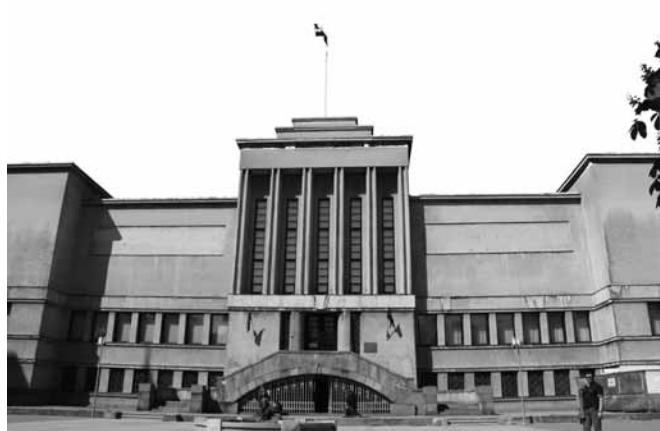
Vytauto Didžiojo karo muziejus.

Šio karo metu pirmą kartą plačiai buvo pradėta naudoti karinė technika (lėktuvai, orlaiviai, šarvuočiai), taip pat ir nuodingosios