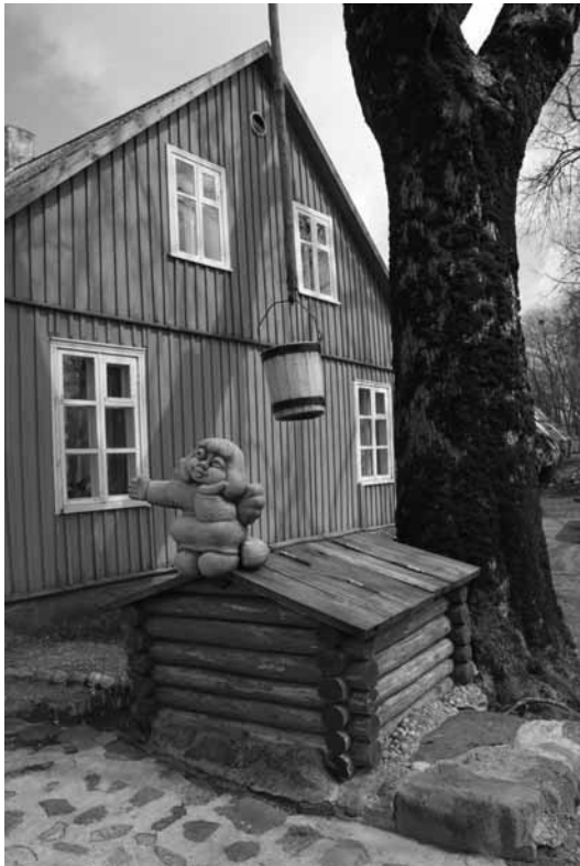
Skulptūra „Angeliukas“, Dailininkas Alfonsas Skiežgilas.