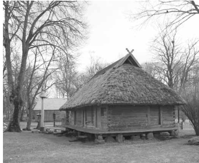
Vyskupo Motiejaus Valančiaus laikus menanti klėtelė muziejaus sodyboje.