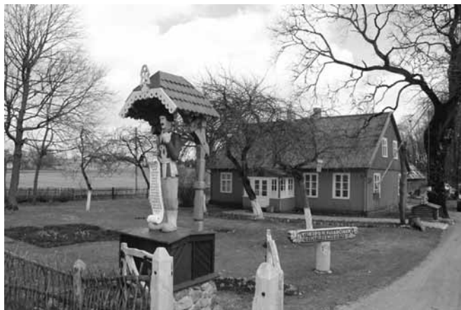
Vyskupo Motiejaus Valančiaus gimtinės muziejaus sodyba Kretingos rajo Nasrėnų kaime 2013 m. pavasarį.

Pagrindinius M. Valančiaus, iškilaus žemaičio, palikusias itin ryš- kų pėdsaką žemaičių tautiniame judėjime, gyvenimo ir veiklos fak- tus prisiminkime šiomis A. Čėsnos eilutėmis, paskelbtomis jo lei-