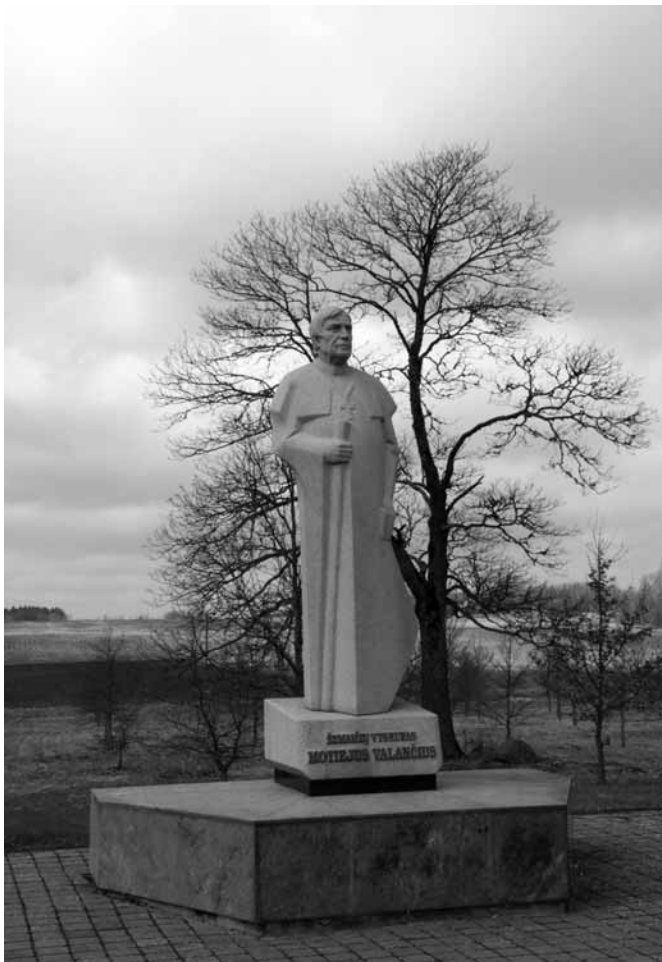
Motiejiaus Valančiaus paminklas Nasrėnuose (Kretingos r.). Skulptorius Kęstutis Balčiūnas, architektas Edmundas Giedrimas.