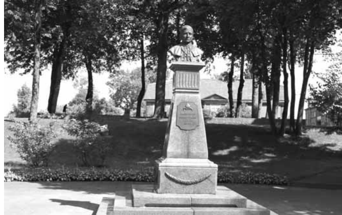
Motiejus Valančiaus paminklas Varniuose 2013 m. birželio mėnesį.