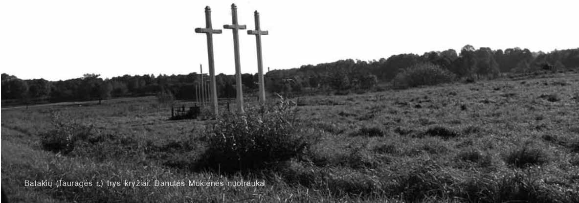
Balakių (Tauragės r.) trys kryžiai.