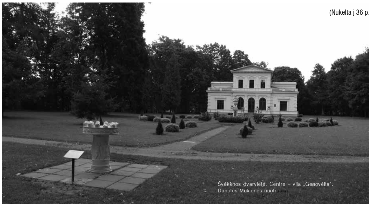
Švėkšnos dvarvietė. Centre – vila „Genovėita“.