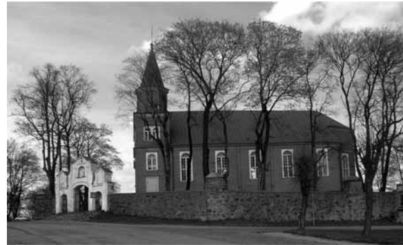
Tverų šv. Mergeles Marijos Apsilankymo bažnyčia (Rietavo sav.).

Kol sukilėliai ir kiti gyventojai caro kazokų nebūdavo matę, buvo pasiryžę kovoti. Tarp valstiečių taip pat buvo pakili nuotaika, nes jie manė, kad nebebus baudžiamos, niekas nebevers eiti dirbti į dvarą, jauniems vyrams neberekės caro kariuomenėje tarnauti. Sukilėliai būriais, po keliasdešimt žmonių, atvykę į miestelius, eidavo pas kunigus ir tardavosi su jais, kad šie iš sakyklos susirinkusiems žmonėms paskelbtų lenkų valdžios manifestą, kad valstiečiai nebemokėtų caro valdžiai mokesčių, nebevykdytų valdžios įsakymų, o klausytų tik naujosios valdžios. Tačiau ir tokia agitacija ne visus paveikė. Dar labiau gyventojai ir patys sukilėliai prarado ūpą ir viltį sukilimą laimėti, kai iš užsienio nebuvo gauta bent kiek svaresnės paramos ir kai sukilimo malšinti atvyko Michailas Muravjovas.