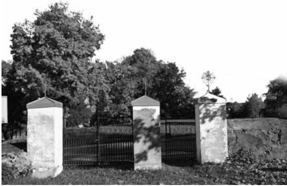
Iš kairės: Balakių kapinių ir Gaurės bažnyčios (Tauragės r.) vartai.