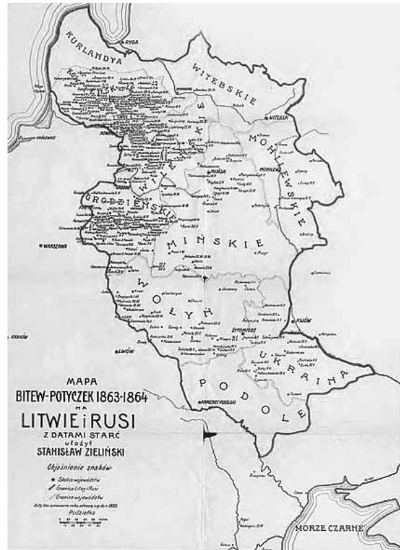
1863 m. sukilimo mūšių vietos Lietuvoje, Baltarusijoje, Ukrainoje ir Rusijoje.

Į sukilėlių gretas įsijungė rekrutai ir ūkininkų bernai, kurie nenorėjo pas ūkininkus dirbti. Rekrutų padėtis buvo sunki. Valsčių val-