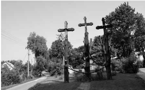
Laukuva (Šilalės r.). (Atkelta iš 31 p.)

riuomenės būrelių užpildinėjimus. Sukilėliai be jokio pasigailėjimo kardavo, šaudydavo šnipus ir išdavikus. Tuo laiku buvo ir įvairiausių apgavysčių. Jei susipykdavo kaimynai, dažnai vienas kitą įskųsdavo. Jei sukilėliai sugaudavo meluojant, smarkiai bausdavo. Jie reikalaudavo, kad būtų sakoma tiesa. Rusai taip pat tiesos reikalaudavo. Nurodžius, kurion pusėn priešai nuėjo, liepdavo pas juos vesti, o jei priešų nerasdavo, labai mušdavo. Nemažai jaunų vyrų miškuose slapstydavosi nuo sukilėlių, nes pastarieji kartais prievarta jaunus vyrus išsivesdavo į savo stovyklas. Žmonės, gyvendami tokiu laikmečiu, dieną ir naktį iš baimės drebedavo.