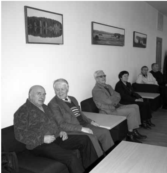
Per Vilniaus žemaičių susibūrimus Vilniaus mokytojų namų svetainėje vietos dažnai per maža...