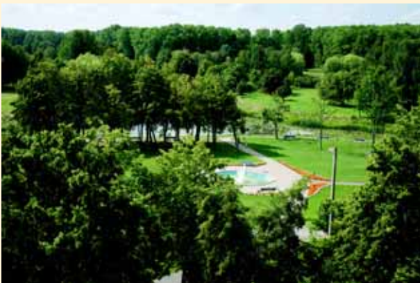
Skuodo parke.