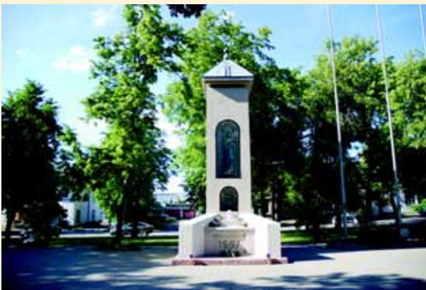
Skuodo mūro kryžius miesto skvere.