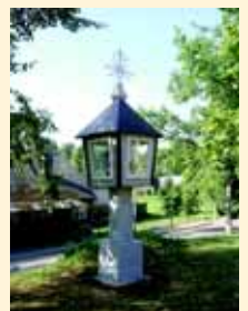
Alsėdžių miestelio (Plungės r.) kryžiai, koplytėlės, koplytstulpiai, stogastulpiai.