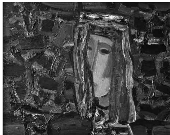
Leonardas Tuleikis (iš kairės): „Rauda. 1977 m., drobė, aliejus, 105 x 120 cm; „Rudenėlis“. 1997 m., aliejus, kartonas, 40 x 50 cm