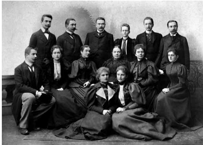
Tiškevičių šeima 1897 metais. Fotografas Stanislovas Filibertas Fleury. Nuotrauka saugoma Kretingos muziejuje, KM IF-6834