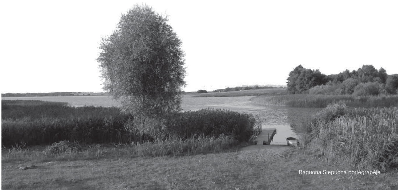
Baguona Stepuona portēgrapējē

Vo prasēdiejē vēskas nu šēnpjūtēs. Jozis, biednuos sosiedēs našlies Daukintienēs sūnos, nu mažomies ējē „ont dēinūm“ pri anuos tieva Gaigala Ontuona, stombiausē suoduos gaspaduoriaus. Mamalē prisakē Zuosē nuneštē pjuoviejems prišpēitūs i Pamēšopēs lonkas. Ešvarēn pradalgīus lig lonkuos krašta, vīrā sostuojē dalgiu ēšpostītē. Tou trumpo atēlsio prisēmetēn, dēdēs balsas ožtraukē: „Napapostēs dalgelē, nanupjausi šēinelē... Valiuoj mona dalgielis, valiuoj, valiuoj...“ Tēp gražē nurīngava ta dainie par lonka, terp krūmāliū, tuolin i Mēnējēs posē. Tēp skardē vedē nati Jozē balsos, tēp poikē anam ontšaukē kētē pjuoviejē. Mosiet tuokart Zuoselē ēr isēstebiejē Jozi ēš artiau, ēr sukrotiejē kažkas šērdie, ligo džiaugsmos, ligo prilonkoms. Pati stebiejuos diel kuo – ligo tas vaikis būtom ēš dongaus nukrētēs, ligo anuo nabūtom pažēnuojosi nu mažomies, kumet, muotinas atsiūsts „ont dēinūm“, ons darba-vuos anuos tievūm nomūs: ēš pērmo kialulēs ganē, paaugēs vērbus kapuojē ar dērvas ekiejē. Vo ka soauga, bova talkēninks pri vēsūm sunkiūju ūkē darbūm. Gaigala nomēškē pri anuo bova pri-pratēn. Vēsūmet tīkos, vēsīms maluonos, niekam naīsēprēklējēs. Anuo napalģinsī so trēmīs vīresnēs bruolēs, katrēi jau bova somētēn vaikē, tvērtē, dailē nuaugēn ēr napamainuomē dainēninkā. Je kumet Daugintienēs sūnā naatējē i suoduos vakarieli, tas bova nalinksmos ēr navikēs: nē kam dainies ožvēstē, nē kam juonkelē sorēkioutē, mergas lig prakaita nušonkintē, lig klietiu palīdjetē, vo