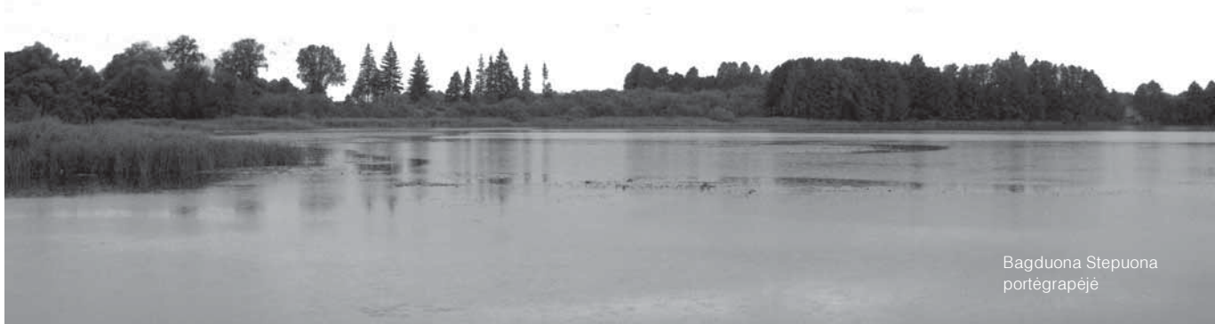
Bagduona Stepuona portėgrapėjė

Tad Gaigala atsėlonkīms so napažīnstamo vaikio bova dėdėlis ĩvikis Mėlkontūm nomūs. Bruolis, sožėnuojės, kad Gaigala pati pažėnuojė anuo tievus, pėršli prijimė dėdėlė maluonė. Sosiedos ož stala, Aniceta tiemėjė jaunōji sveti. Ons siediejė tīkos, nadrōsos, kažkuokio platio žėpuono apsėvėlkės, ligo ont ėšaugėma pasiūto. Pana jug nagaliejė žėnuotė, kad tas žėpuons bova na anuo, vo ėš