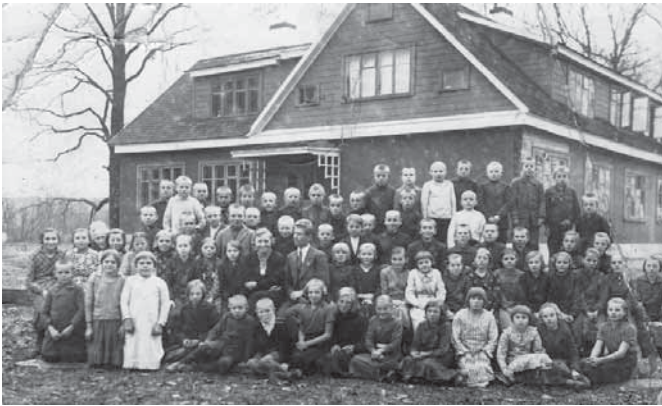
Mokiniai prie Baublių mokyklos. Metai nežinomi