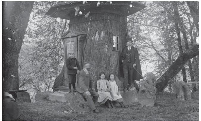
Baublys prieš uždengiant jį mediniu gaubtu. Metai nežinomi