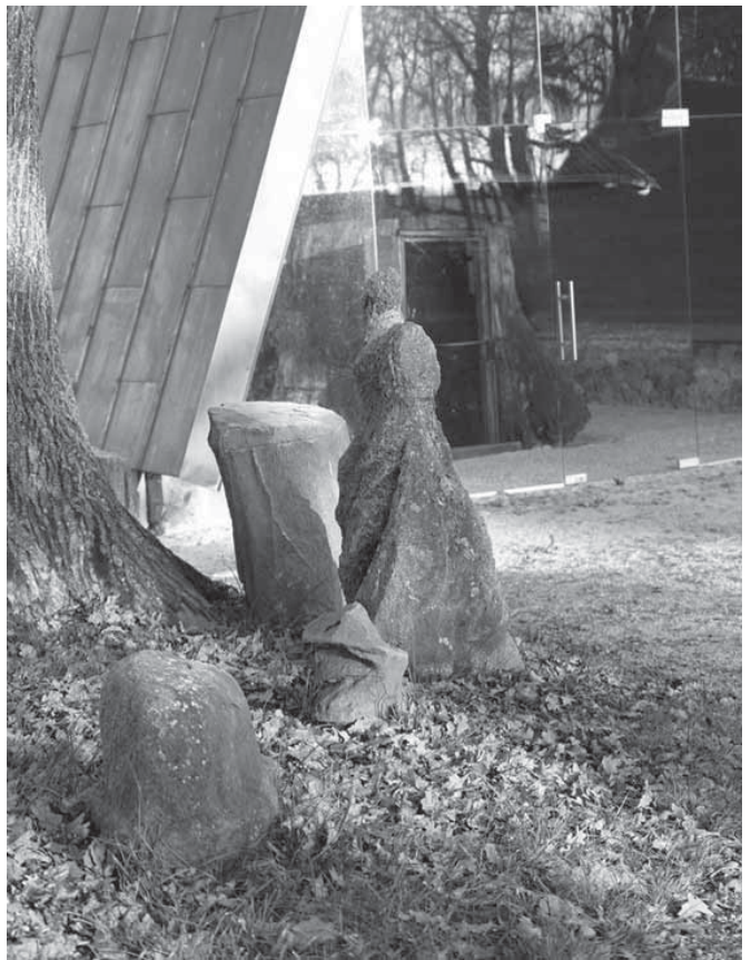
Stabakūliai prie Baublio 2011 m.

prieš keletą metų mirusios savo žmonos Uršulės amžinojo poilsio vietas. Ant akmeninio antkapio buvo užrašyti žodžiai: „Žinok, ateivi, jog tai kapas yra Žemaičio mokyto ir garbingo vyro, kurs kalbą tėvų savo ištaisyti troško, o patsai vadinos Dionyzas Poška. Metuos 1830 smertis užtiko, bet uždirbta pasaulį šlovė jo paliko“.