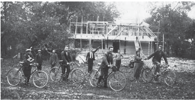
Mokyklos statyba 1930 m.