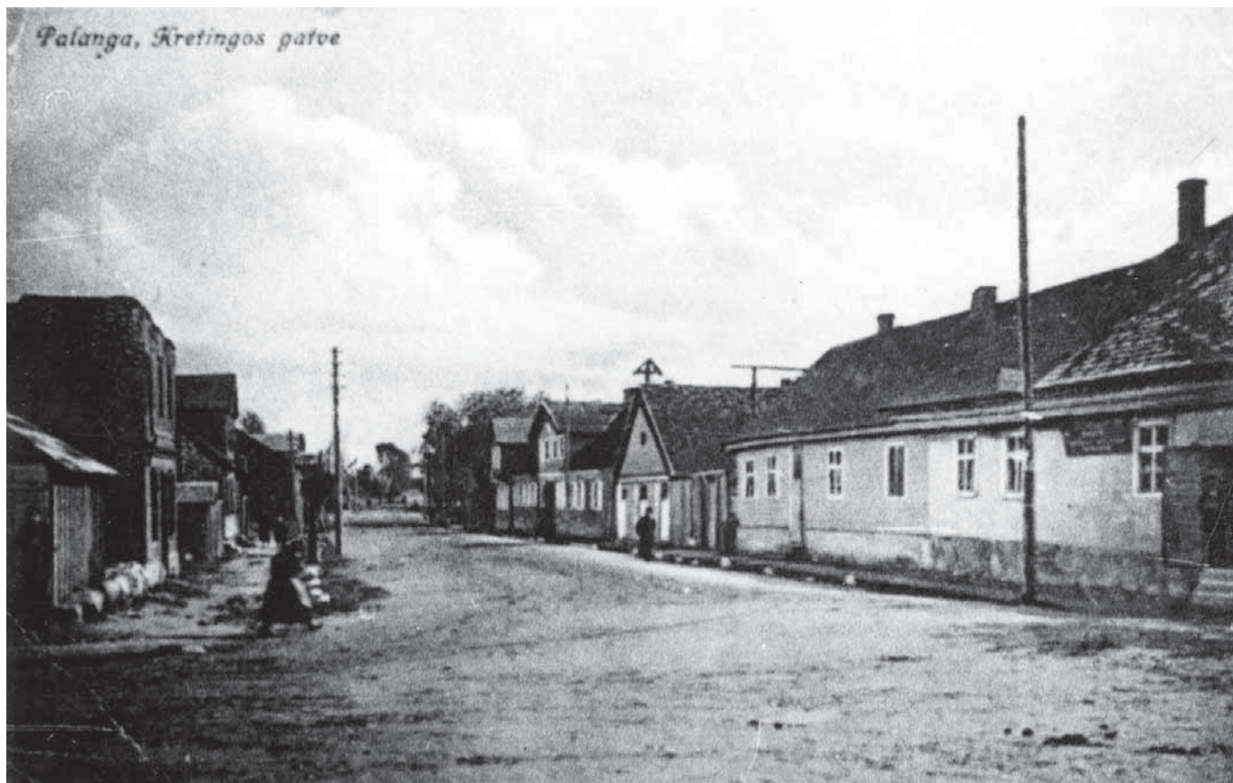
Palangos miesto Kretingos gatvė XIX a. pab. – XX a. pr.