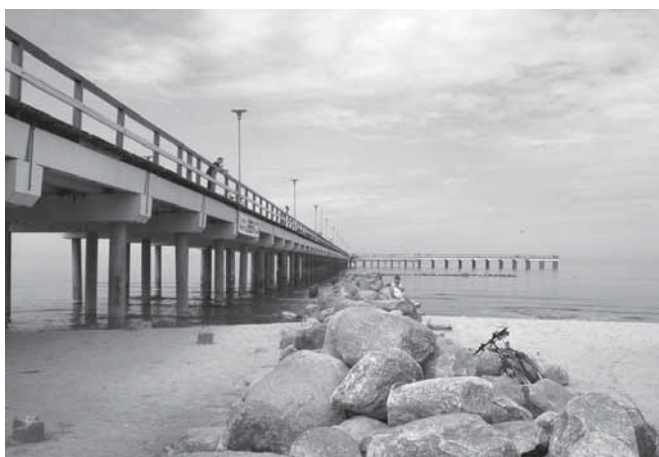
Palangos tiltas į jūrą 2002 m. vasarą.

Fragmentai iš prisiminimų aplankius Palangą 1924 m. (Mykolas Vaitkus, Nepriklausomybės saulėj , Londonas, 1969, p. 27–29)