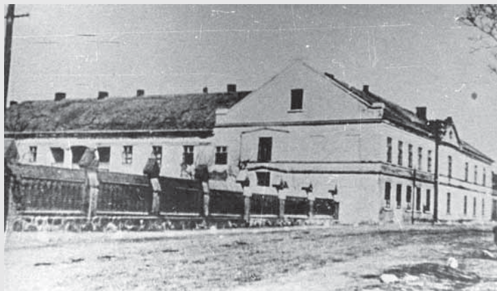
Palangos progimnazijos pastatas XIX a. pab.