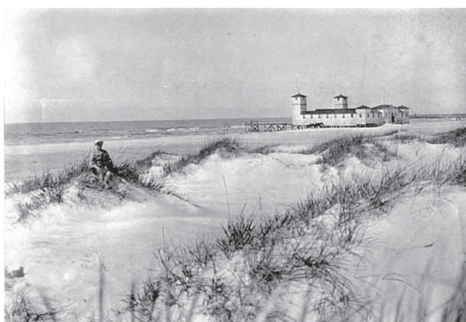
Palangos pajūris XIX a. pab. – XX a. pr.

šalia – Jasenas su Vaižgantu, ir aš. [...] Taip lengva sieloj... Jokio rūpesčio. Žmonės tokie meilūs. Vien lauki kažko gero ir įdomaus. Štai ir tiltas tiesias į jūrą. Kaip gaila, kad jis nūnai toks trumpas [...].