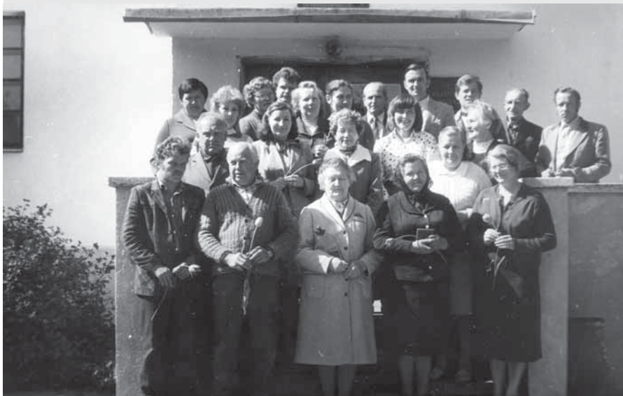
Muziejaus kolektyvas 1986 m.