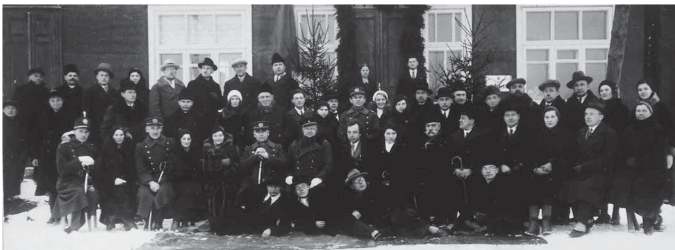
Žemaičių muziejaus „Alka“ atidarymo (1932 m. vasario 16 d.) dalyviai (Telšiai, Birutės gatvė)

iki 1931 metų. Tada vaikščioti jis jau nebegalėjo, per kambarį judėdavo tik sėdėdamas kėdėje. Vėliau tėvai jam nupirko dviratį vežimėlį – „bėdą“, į kurią pakinkęs kumelaitę visą likusį gyvenimą ir važinėjo. Tiesa, iš kambario iki vežimo jį turėdavo kas nors atnešti, reikėdavo jį ir į vežimą įkelti.