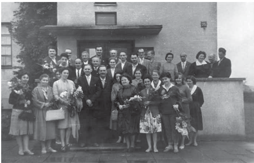
Gruzijos muziejininkų seminaro dalyviai Telšių kraštotyros muziejuje 1965 m.