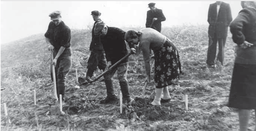
Pirmosios Žemaičių muziejaus „Alka“ surengtos archeologinės ekspedicijos (Siraičiai, Telšių r.) dalyviai. 1956 metai