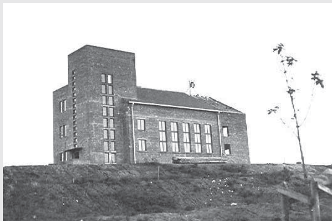
Žemaičių muziejaus „Alka“ pastatas 1938 metais