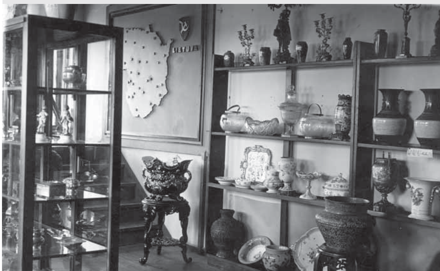
1949 m. veikusi Žemaičių muziejaus „Alka“ dvarų paveldo ekspozicija