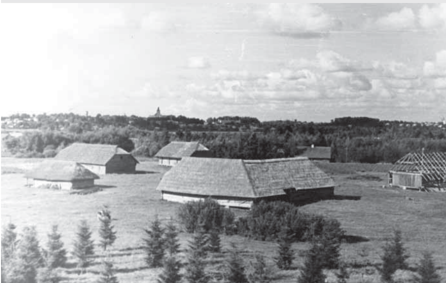
Žemaičių muziejaus „Alka“ buities skyriaus fragmentas. 1973 metai