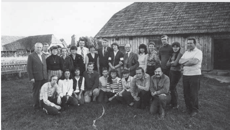
Muziejaus kolektyvas Kaimo buitės skyriuje 1997 m.