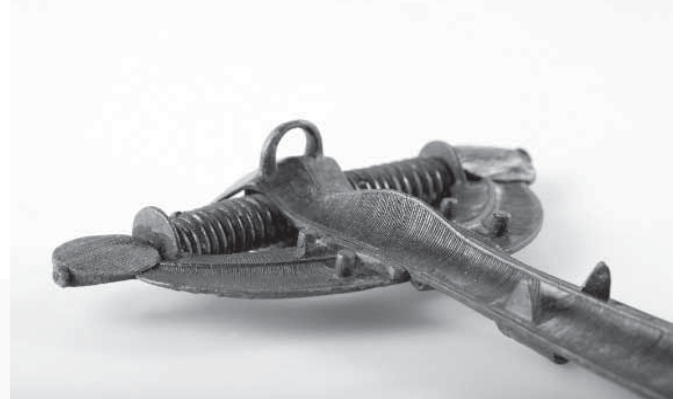
Lankinė aguoninė segė. Pavirvytė, X–XI a.

Ekspozicijoje rodoma Mažeikių muziejuje sukaupta archeologinė medžiaga iš kuršių, žiemgalių ir žemaičių regiono tyrinėtų archeologijos paminklų – piliakalnių, Zastaučių, Kulių, Kivylių, Pavirvytės kapinynų ir iš Telšių bei Ventspilio muziejų paskolinti radiniai, baltų genčių teritorijų, kuršių, žiemgalių ir žemaičių kapinynų, piliakalnių ir mūšių vietų žemėlapiai, šias žemes vaizduojantys XVII a. pradžios istoriniai žemėlapiai. Ekspozicijos sudėtinė dalis – į ją sumaniai įkomponuoti palydimieji (įžanginiai) tekstai, kuriuose pateiktos ir svarbiausios kuršių, žiemgalių bei žemaičių istorijos datos.