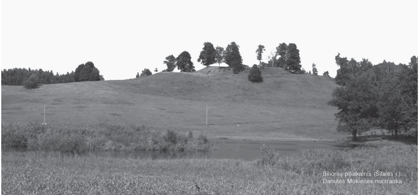
Billionių piliakalnis (Šilalės r.). Danutės Mukienės nuotrauka