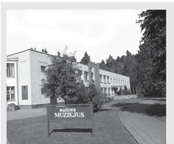
Mažeikių muziejus.