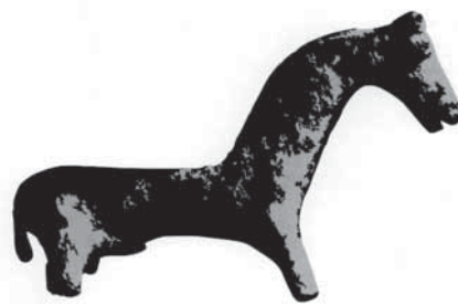
Viršuje – žirgelio pavidalo figūrėlė iš Kukių. XI–XII a. (?); Apačioje – Zastaučių antrojo pilkapio šiaurės rytinė dalis kasinejimų metu – 1974 m. rugpjūčio 1–6 dienomis.