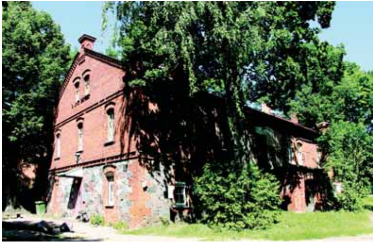
Danutės Mukienės nuotraukose – Lentvario dvaro sodybos vaizdai