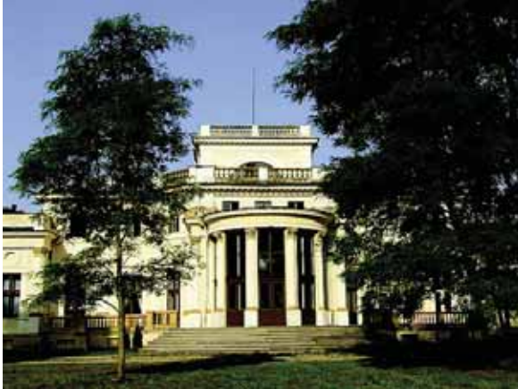
(Atkelta iš 17 p.)

kad pinigai, jog jei tokia ramybė šiame parke bus dar vieną ar kitą dešimtmetį, jei nesikeis parko ir dvaro šeimininkai, ši sodyba pasmerkta sunykti. Akivaizdu, kad norint, jog šis rūmų ansamblis išliktų, neuplenta, jog būtų įstaiga, institucija ar visuomeninė organizacija, kuri rūpinasi, jog laiku būtų atnaujintos rūmų ir koplyčios durys. Matosi, kad eina bent jau paskutiniaisiais metais nebuvo vieno visu dvaro sodybos kompleksu, jos rekonstravimu besirūpinančio šeimininko. Vienas rūpinasi rūmais, kiti dalia jėgą esančiais kitais pastatais, trečias parko teritorijoje organizuoja menininkų plenerus, stovyklas ir jėgū kūrinius – akmenimis, į kuriuos lyg į kokias įmogaus dirbtis yra susmaigstyti metalo strypai, „papuošia“ dvaro sodybą. Kai pūri į tuos kūrinius šioje aplinkoje tiesiog daltis kūnā kausto – dėl kartais mus apimančios inercijos, nesusivokimo, kur gyvename, kas yra mūsų gyvenimo pagrindas ir grožio dėmė. Gražus tas Trakų Vokės parkas, tačiau, kol ten pievelėje guli tie rūdijančio metalo strypais