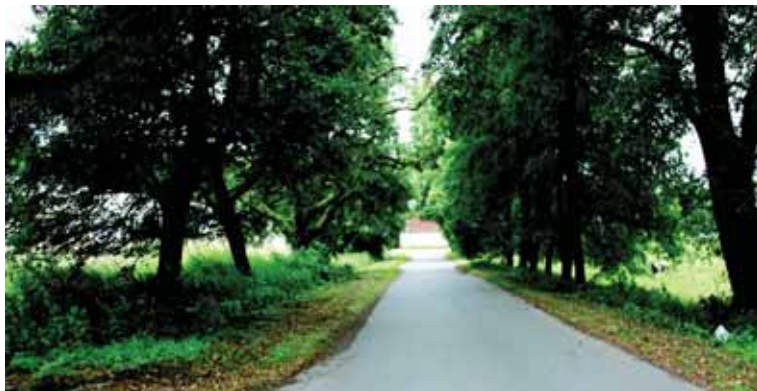
Senajame parke.

1940 m. liepos mėn. SSRS okupavus Lietuvą, pastarosios diplomatinio tarnybo atstovai daugelio užsienio šalių vyriausybėms