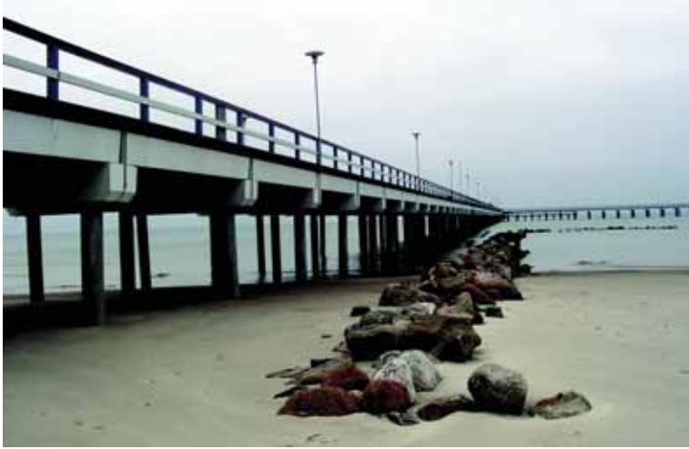
Palangos tiltas į jūrą.

tija, kurios programoje buvo pasisakoma už vietos savivaldos išplėtimą ir už Lenkijos Karalystės autonomiją Rusijos sudėtyje. Partija siekė sustiprinti katalikų dvasinininkijos pozicijas krašte. Jai ataką darė Rusijos kadetų (konstitucinių demokratų) programa.