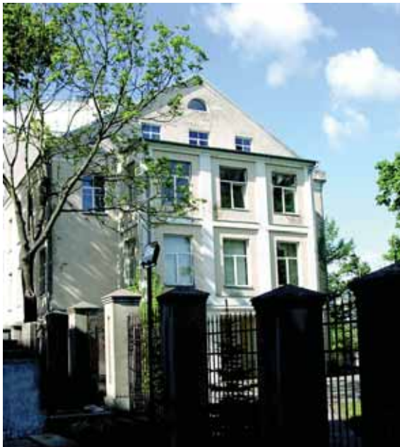
(nuo virðaus): Telšio katedra ir Telšio kunigo seminarijos pastatas

spalio 27 d. – Lietuvos kariuomenės rinktinė þengė á Vilniø. Respublikos sostinė ėmė kontroliuoti Lietuvos Vyriausybės ágaliotinis Vilniui ir Vilniaus kraðtui A. Merkys.