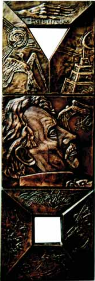
Medalis, skirtas kompozitoriui ir dailininkui Mikalojui Konstantinui Eurlionui. Dailininkas Petras Gintalas.