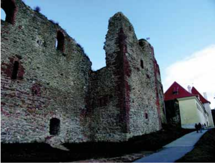
Istorijos liudininkai. (Atkelta iš 45 p.)

spektaklis – A. Keturakio komedija „Amerika pirtyje“.