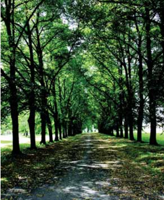
Senajame parke.