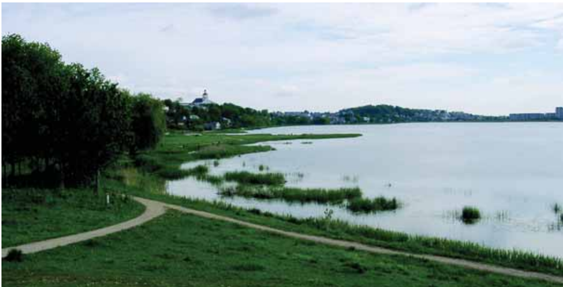
Telšiai. Masėio ežero pakrantė.

1920 m. balandžio 14–16 d. – Įvyko rinkimai į Steigiamąją Seimą. Laisvus, demokratinius principais organizuotus rinkimus į Steigiamąją Seimą absoliučia balsų persvara (59 iš 112) laimėjo krikščionių demokratų blokas.