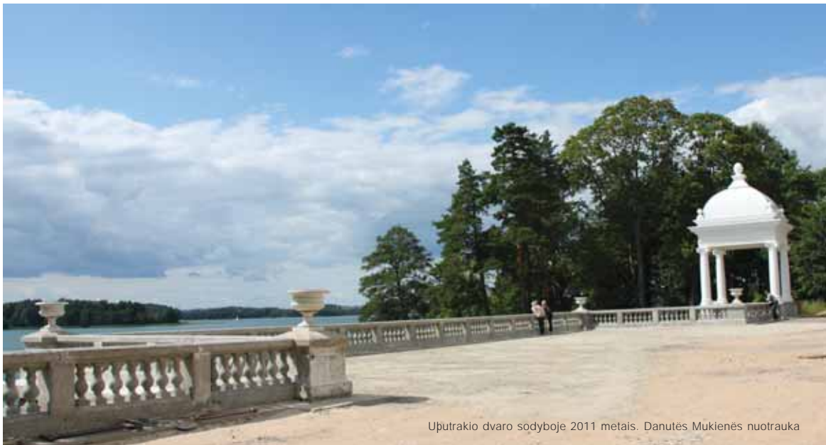
Uþutrakio dvaro sodyboje 2011 metais. Danutės Mukienės nuotrauka