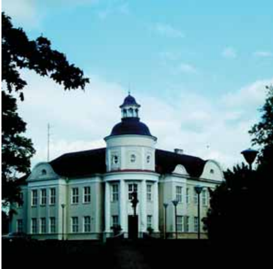
Telšiu vykupijos kurija.