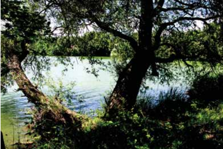
Epero pakrantė.