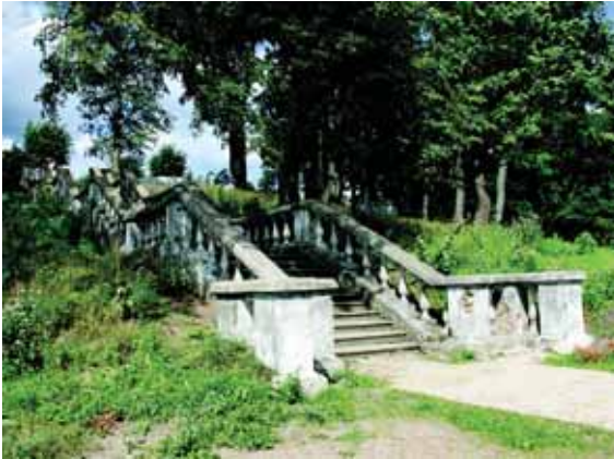
Uputrakio dvaro sodyboje 2011 metais.