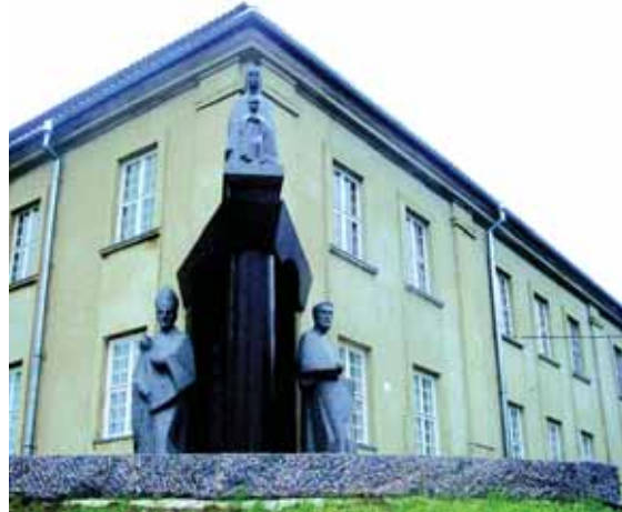
Paminklas Merkeliui Giedraičiui ir Mikalojui Daukđai Varniuose. Skulptorius Arūnas Sakalauskas.

1606–1607 m. – Lenkijoje vyko vidaus karas (bebrpudovskio rokočas). Karo metu vyko opozicijos, nepatenkintos karaliaus Zigmanto Vazos bandymais sustiprinti karaliaus valdžią, maištas (ro-