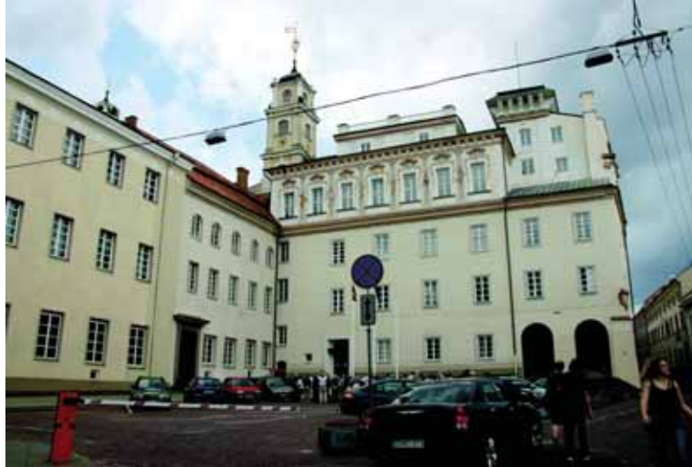
Vilniaus universitetas 2011 m.

1576–1586 m. – Lietuvos didžiojo kunigaikščio ir Lenkijos karaliaus Stepono Batoro valdymo laikotarpis.