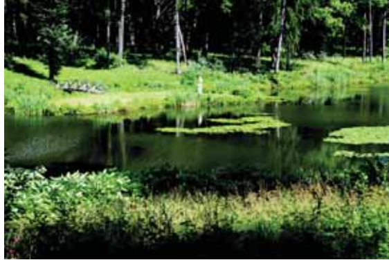
Vasara Uþtrakyje.

1503 m. – Uþ paramą kariaujant su Maskva iðvartijams þy-dams leista sugrąþti į Lietuvos Didþiąją Kunigaikðtystę. Valdovas