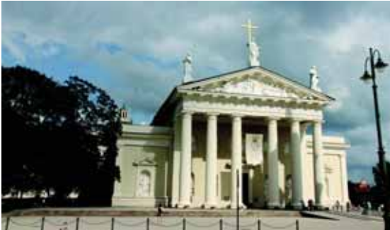
Vilniaus arkikatedra.