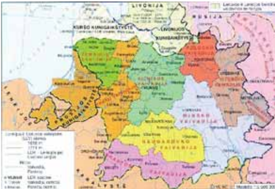
LDK XVI–XVII ambiuje.

1559 m. rugpjūčio 15 d. – Livonijos Ordina globojo ir saugojo bygimantas Augustas.