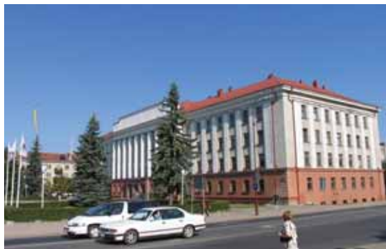
Kairėje – Ādaulės katedros bokštas ir Ch. Frenkelio rūmų ekspozicijos fragmentas, viršuje – Ādaulės miesto centrinės dalies vaizdas.