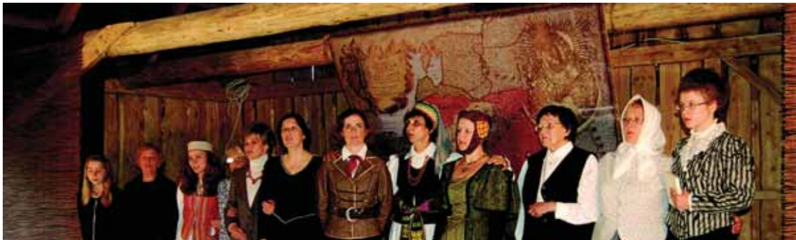
Vilniaus miesto „Pilaitės“ teatro aktorai „Konėalėje“ 2011 metŏ vasarà

Garsas apie plobinuose pastatytà spektaklį pasklido toli. Su ūiuo spektakliu plobiniŏkiai aplankė ne vienà kaimyninà bendruo- (Nukelta à 40 p.)