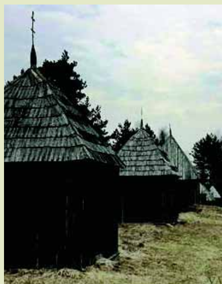
Berþoras.