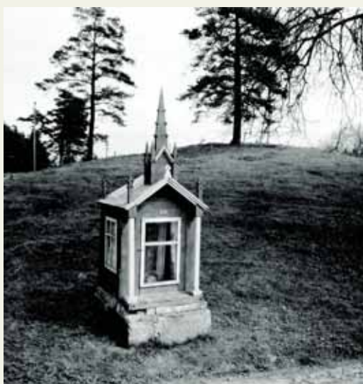
Berboro (Plungės r.) koplytėlė. Fotografuota 1989 metais